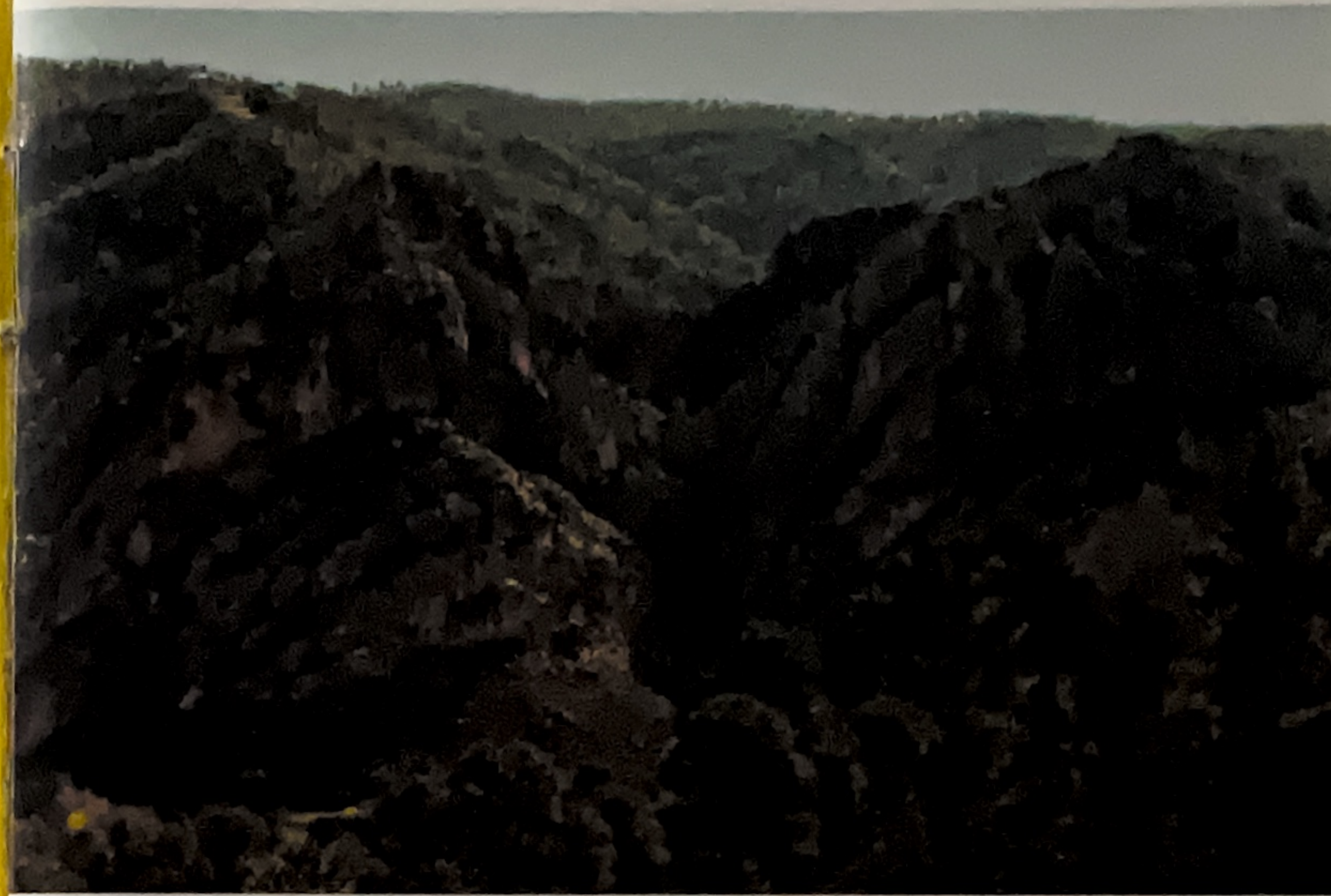
"Cuchillos" de las Hoces del Cabriel

El Cabriel , que ha sido distinguido como el río más limpio de Europa, es el artífice de las agrestes y espectaculares Hoces , un paisaje compartido por las provincias de Cuenca y Valencia que sobrecoge por su belleza y valor ambiental. En su parte confluence se constituye una reserva natural de más de 1.600 hectáreas que limita con la parte más meridional del embalse de Contreras . Un paraíso para fauna como el águila real y la cabra montesa y para flora como el boj, el enebro y los pinos carrascos, entre otras especies. Varias sendas recorren este espacio en el que se incluyen parajes tan imponentes como Los Cuchillos de Contreras, las Hoces del Cabriel, con paredes verticales de más de cien metros, el Valle de Fonseca o Las Cárcavas, que configuran un espacio muy singular por la gran cantidad de formaciones geológicas que se inscriben en él y por ser la única zona de hoces de La Manchuela, donde el río Cabriel con su potencia erosiva ha labrado un abrupto paisaje.