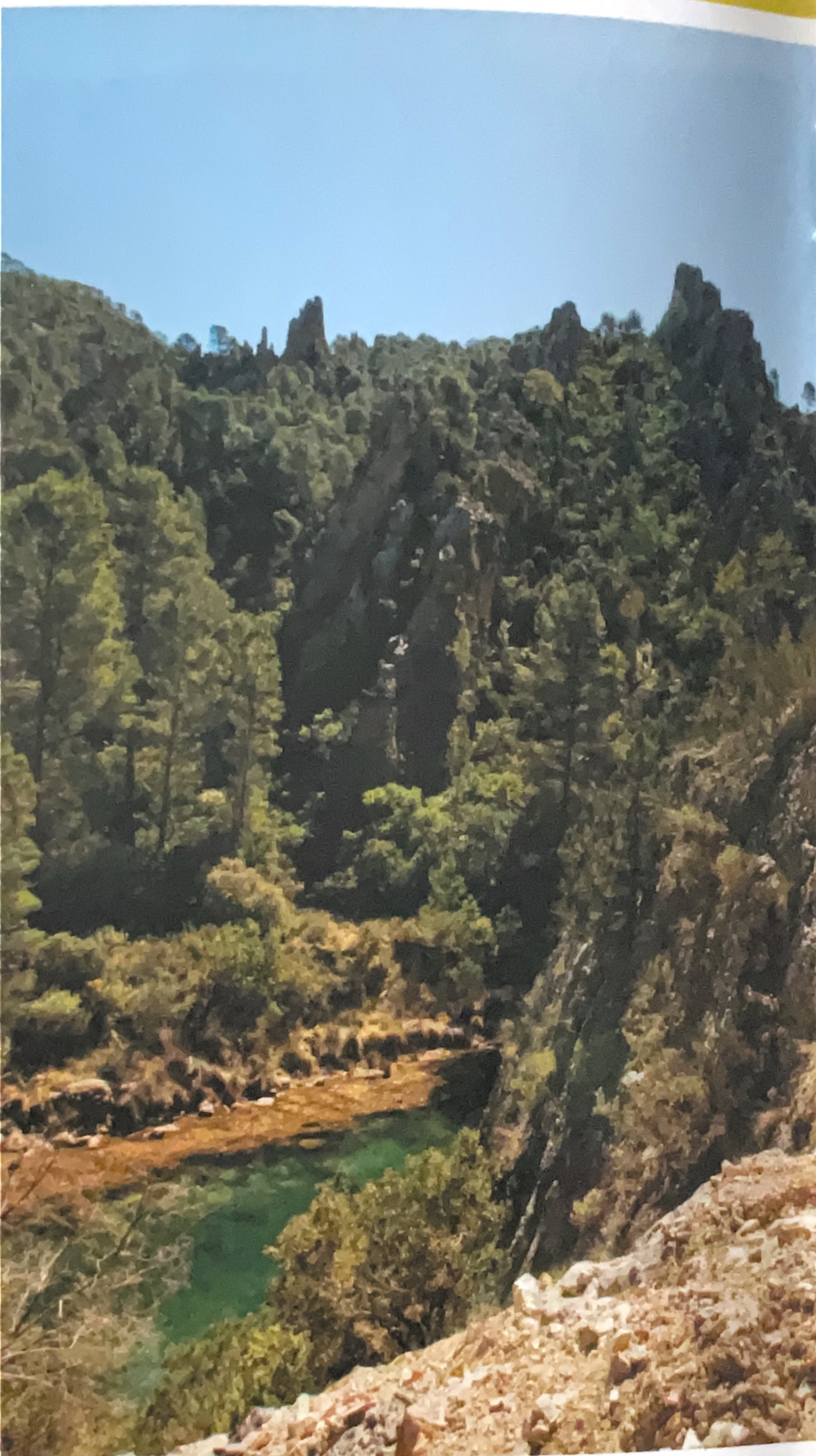
Río Cabriel a su paso por los Cuchillos de Contreras