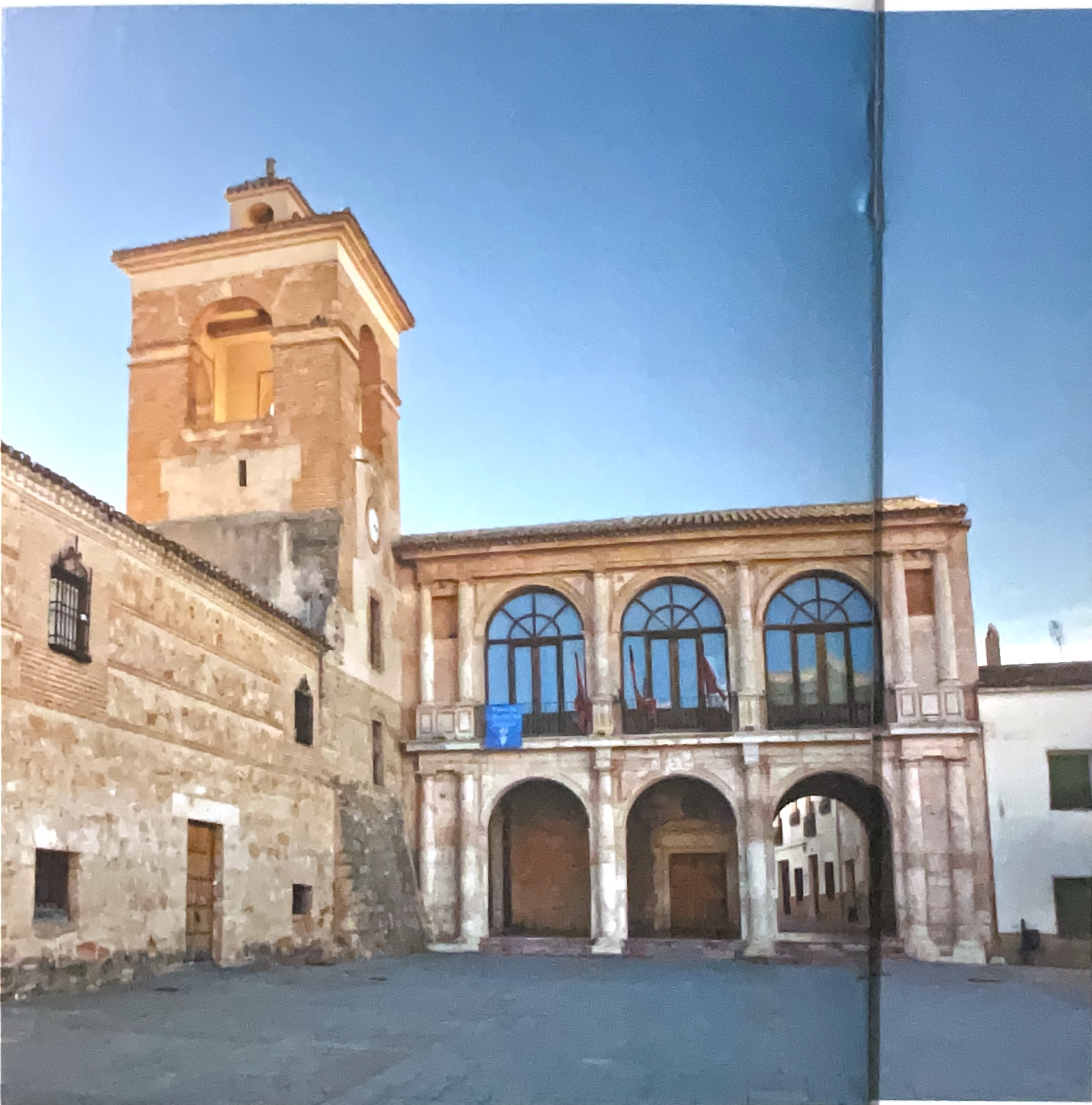
Ayuntamiento, posada Massó y la iglesia de Ntra. Sra. de las Nieves

El convento jareño de Santa Ana fue fundado por Santa Teresa de Jesús