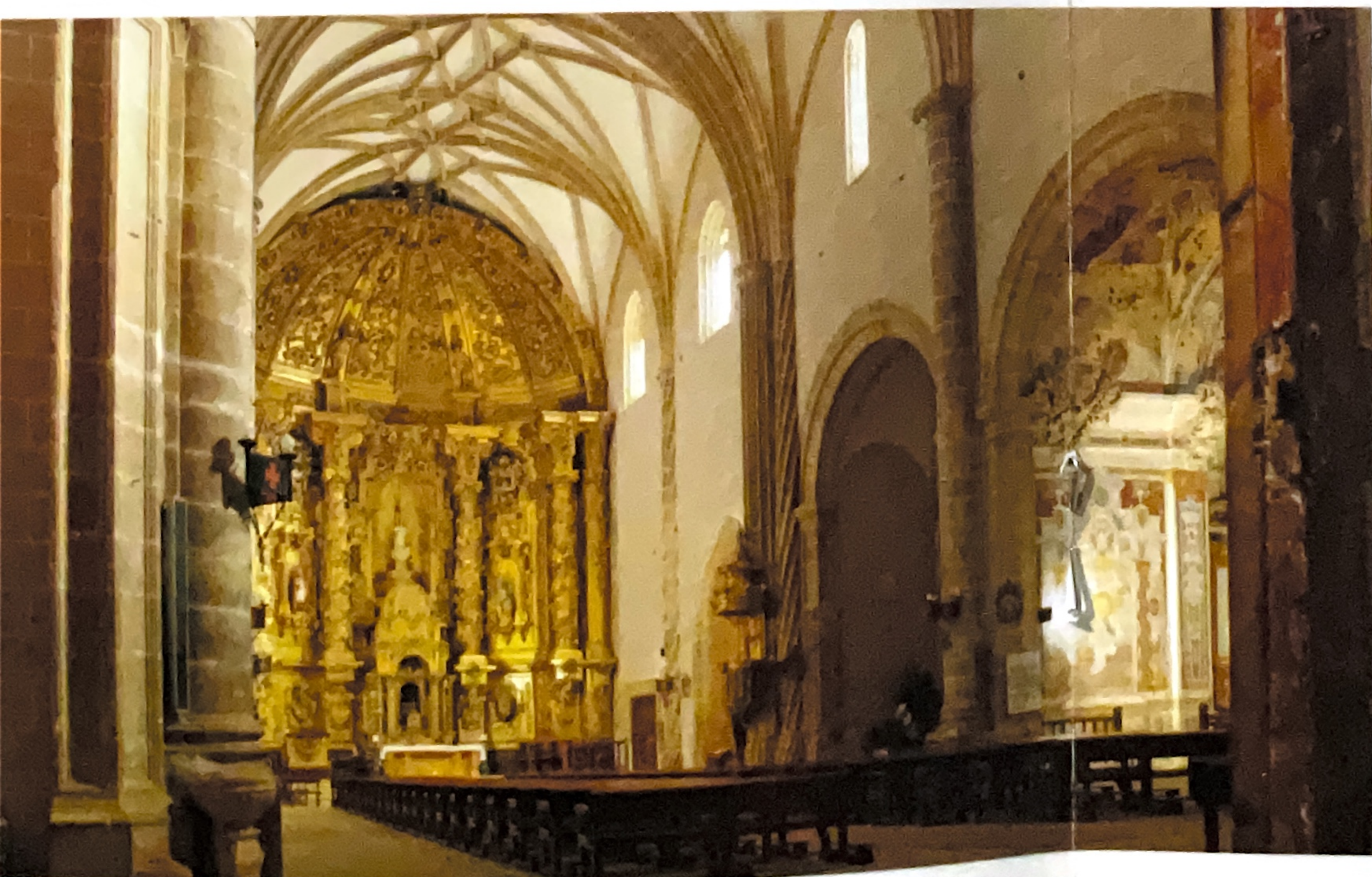
Nave central y capilla de la Virgen del Rosario

Entre las portadas destaca por su calidad la Norte, de estilo manierista. Del interior es imprescindible citar el retablo del Altar Mayor, una colosal obra barroca en la que el horror al vacío se combate con detalles llenos de belleza y magnas propuestas como una gigantesca escultura de San Julián. De las capillas, tres se distinguen especialmente: la de la Inmaculada Concepción, con retablo de transición del gótico al renacimiento, la de la Virgen del Rosario, con una preciosa cúpula, y la de la Virgen del Pilar, que alberga otro retablo del XVI.