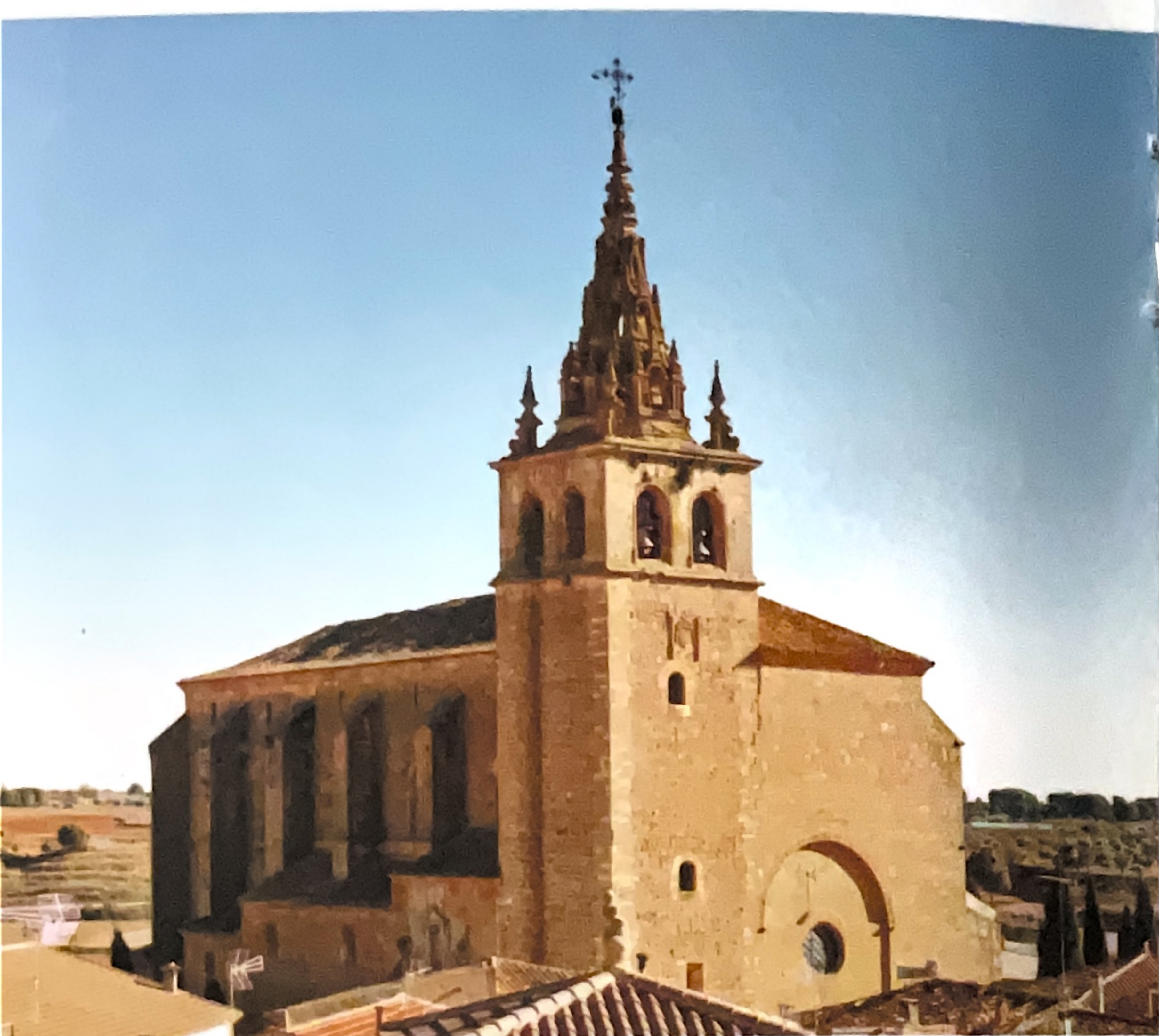
Basílica de Nuestra Señora de la Asunción, Villanueva de la Jara

A 18 kilómetros conduciendo por la N-310 se llega a Villanueva de la Jara , una auténtica delicia para los amantes del patrimonio histórico-artístico. Allí se encuentra la denominada popularmente 'Catedral de La Manchuela'. Se trata de la Basílica de Nuestra Señora de la Asunción, templo del gótico tardío cuyo imponente perfil puede ser divisado a varios kilómetros de distancia. Su símbolo más reconocible es una torre de 75 metros de altura coronada con un original chapitel.