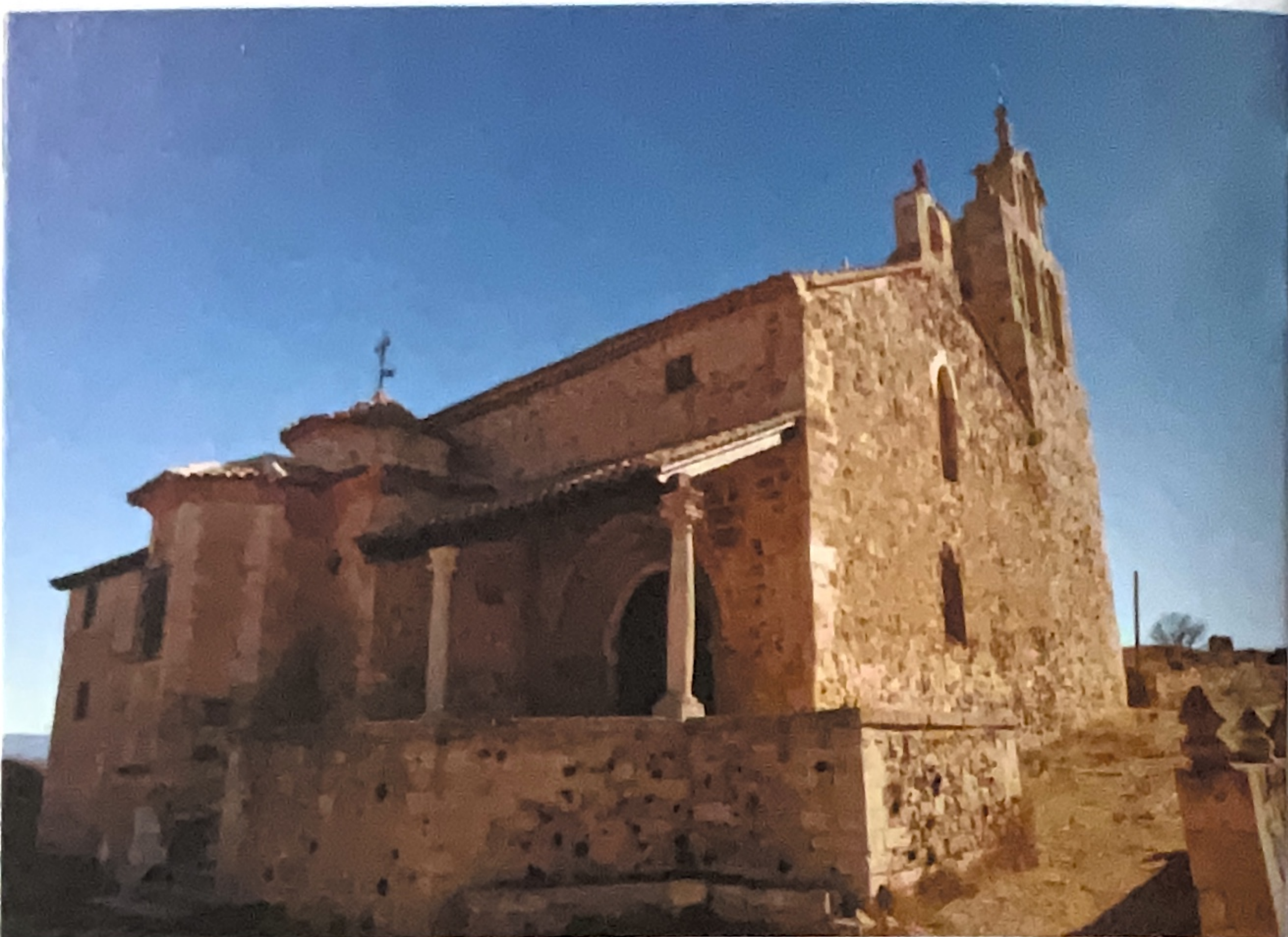
Iglesia de Santa María la Mayor, Moya

Hay que regresar por la N-420 para llegar a Boniches , bañado por el Cabriel y rodeado de vegetación. Un término municipal ideal para el senderismo.