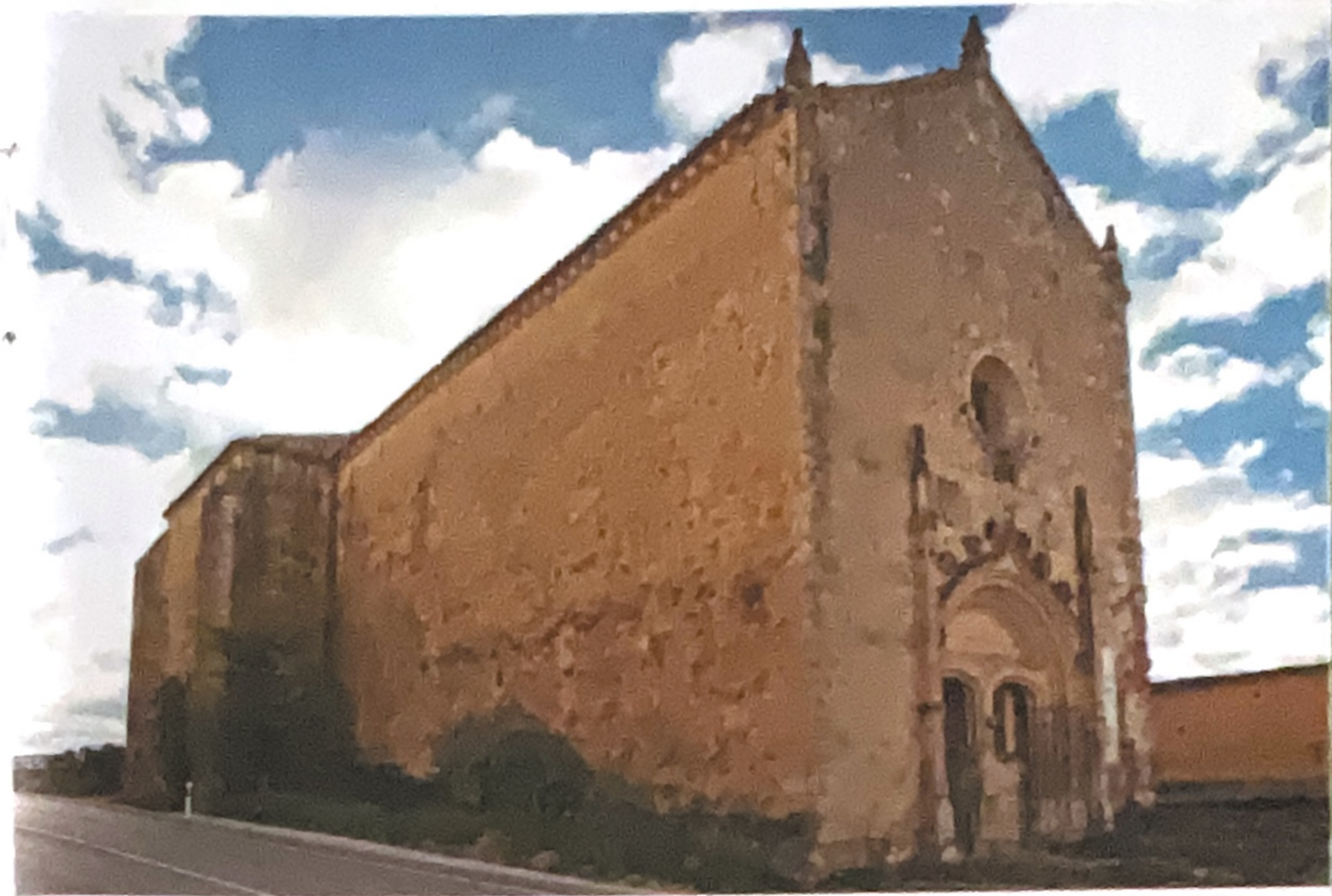
Panteón de los marqueses de Moya, Carboneras de Guadazaón