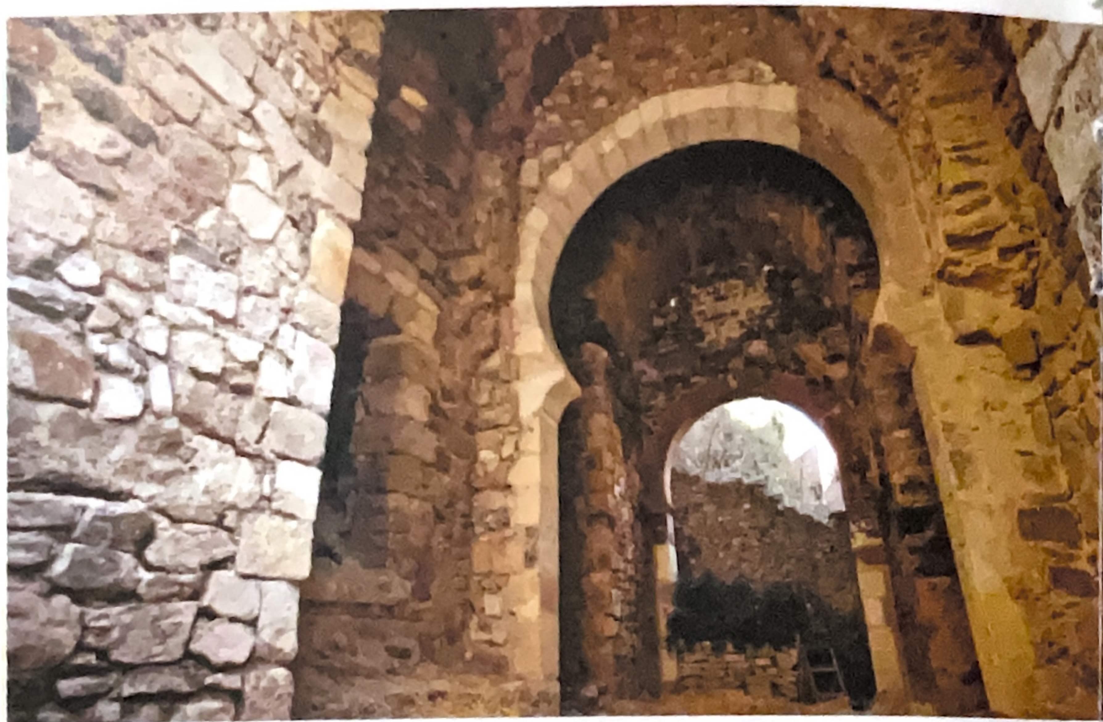
Puerta de Las Eras, Cañete

durante millones de años. El camino es una experiencia y una delicia para los sentidos. Cerros llenos de pinares, choperas y tierras de labor salpican hoces y riberas en un mosaico multicromático en el que se respira naturaleza. Paisajes para reconciliarse con la creación.