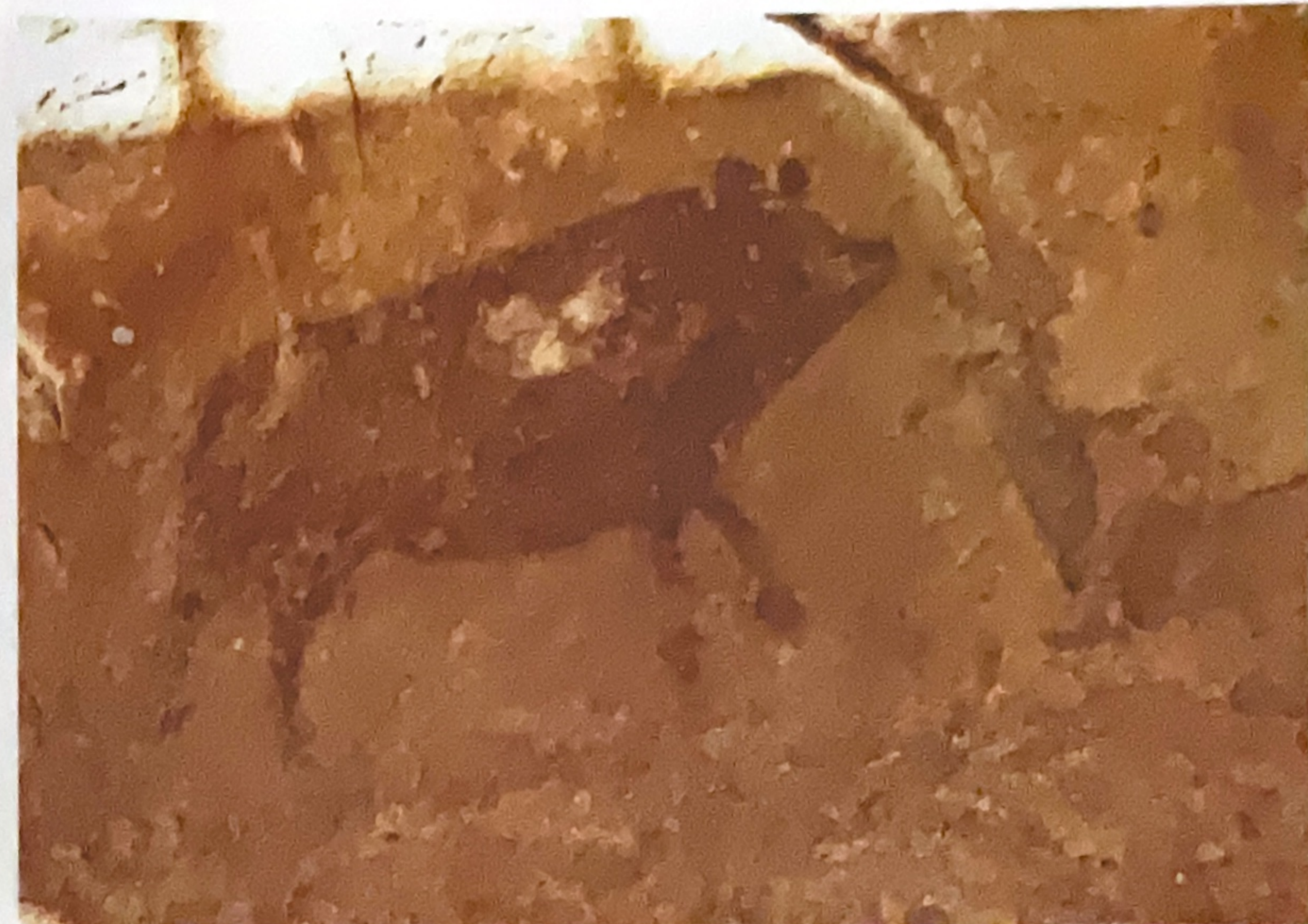
Pintura rupestre, Villar del Humo

Las pinturas rupestres de Villar del Humo están declaradas Patrimonio de la Humanidad por la UNESCO junto a todas las del Arco Mediterráneo. Se sitúan en diversos refugios y abrigos poco profundos de parajes como la Peña de Escrito, Selva Pascuala y la Peña del Castellar y suman más de 170 figuras. Las representaciones se ubican en dos momentos históricos: Neolítico (de carácter naturalista y tonos rojizos) y Edad de Bronce (con una variedad cromática que oscila entre el anaranjado y el castaño azulado).