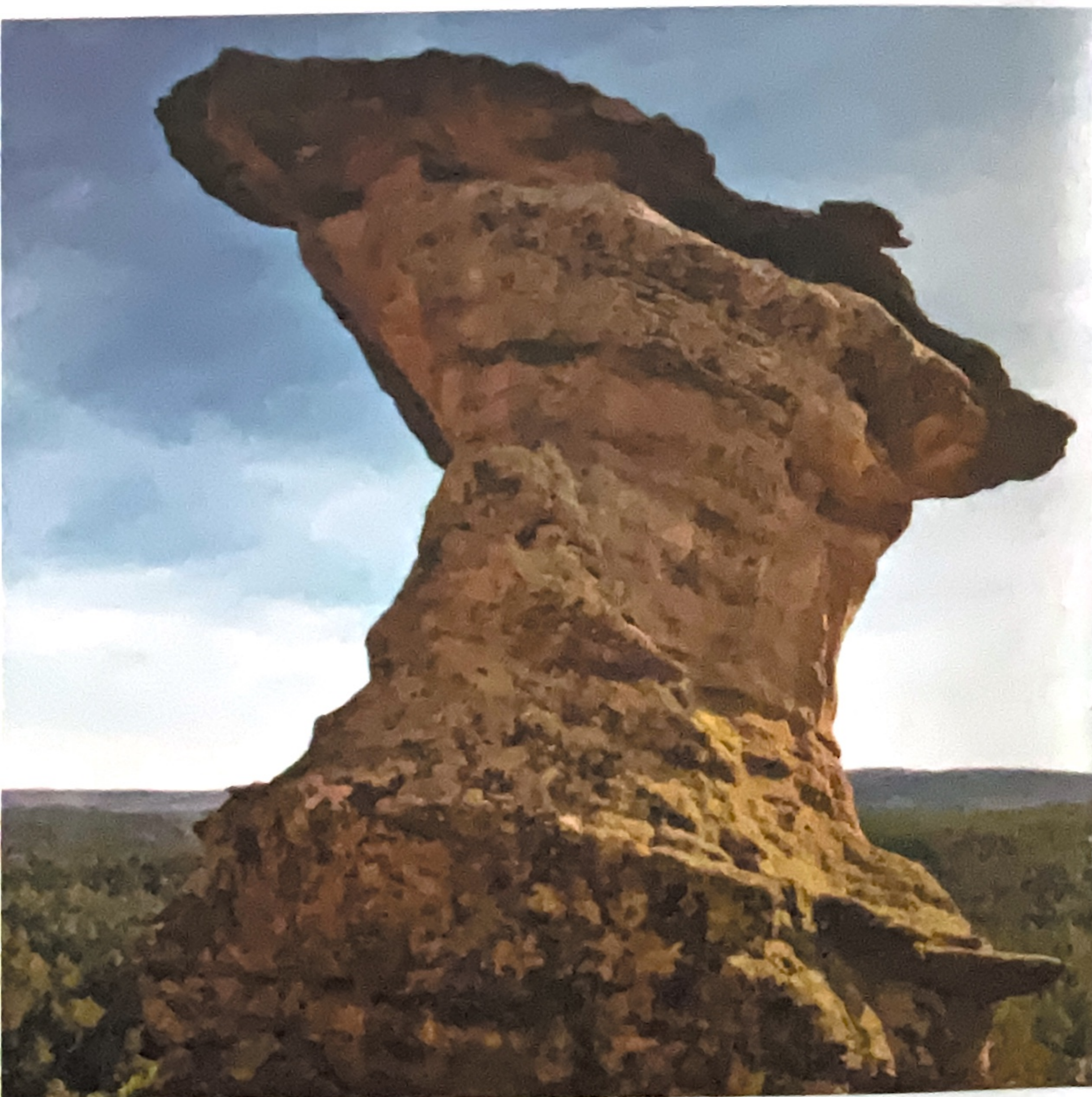
Las Corbeteras, Pajaroncillo

Por la carretera N-420 se llega a Pajaroncillo , rodeado de ricos yacimientos arqueológicos prehistóricos y en cuyas cercanías está el paraje de Las Corbeteras. El agua ha erosionado el paisaje y esculpido curiosas formas y chimeneas en la roca caliza entre las que el viajero puede pasear imaginando el paso de los siglos y cómo han modelado esas rocas