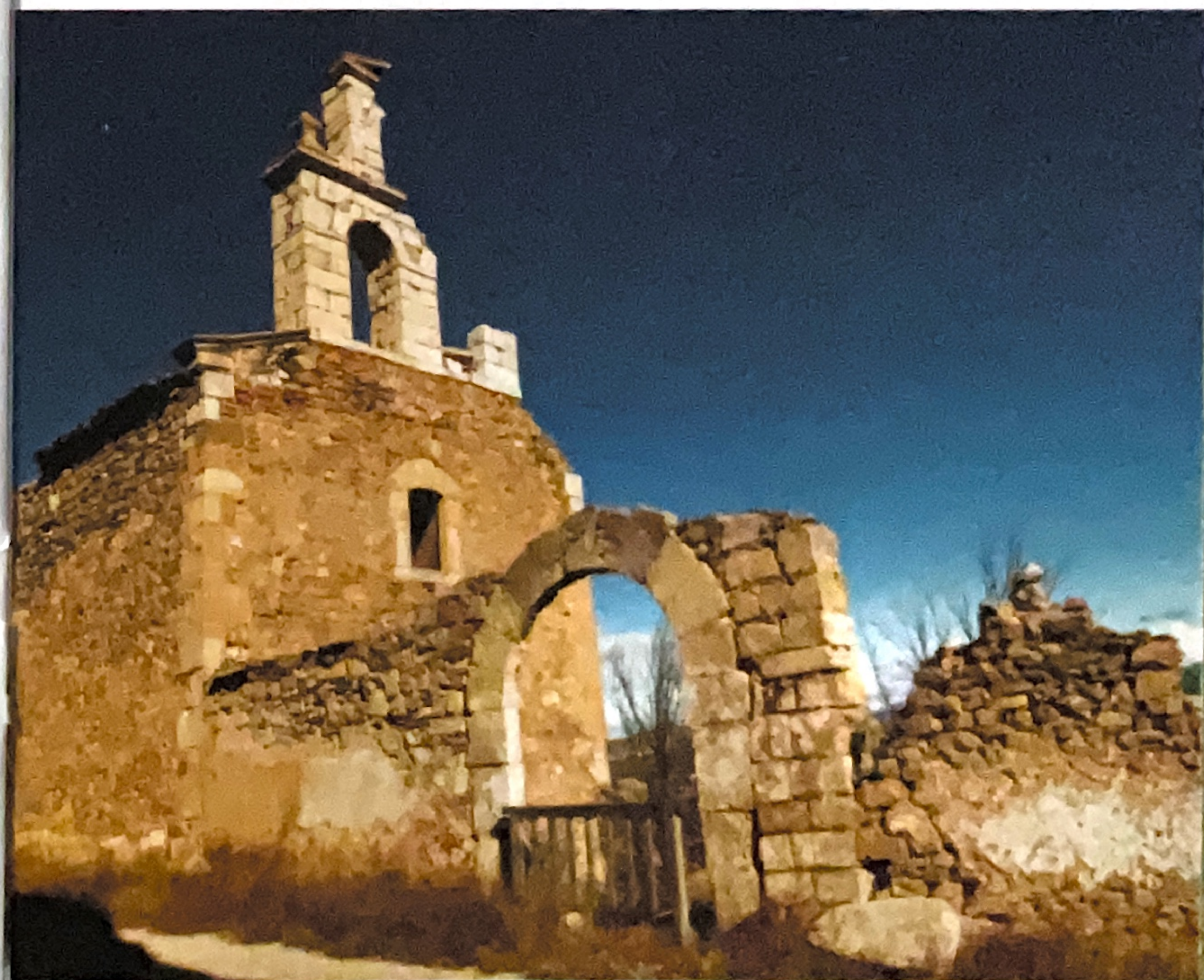
Ruinas de la iglesia de San Bartolomé, Moya

La N-330 conduce a Talayuelas a escasos diez minutos en coche. Su laguna silíceo, una de las pocas existentes en España, y El Pico de Ramera son emblemas de su patrimonio medioambiental. Del religioso, la iglesia de la Asunción (siglo XVII).