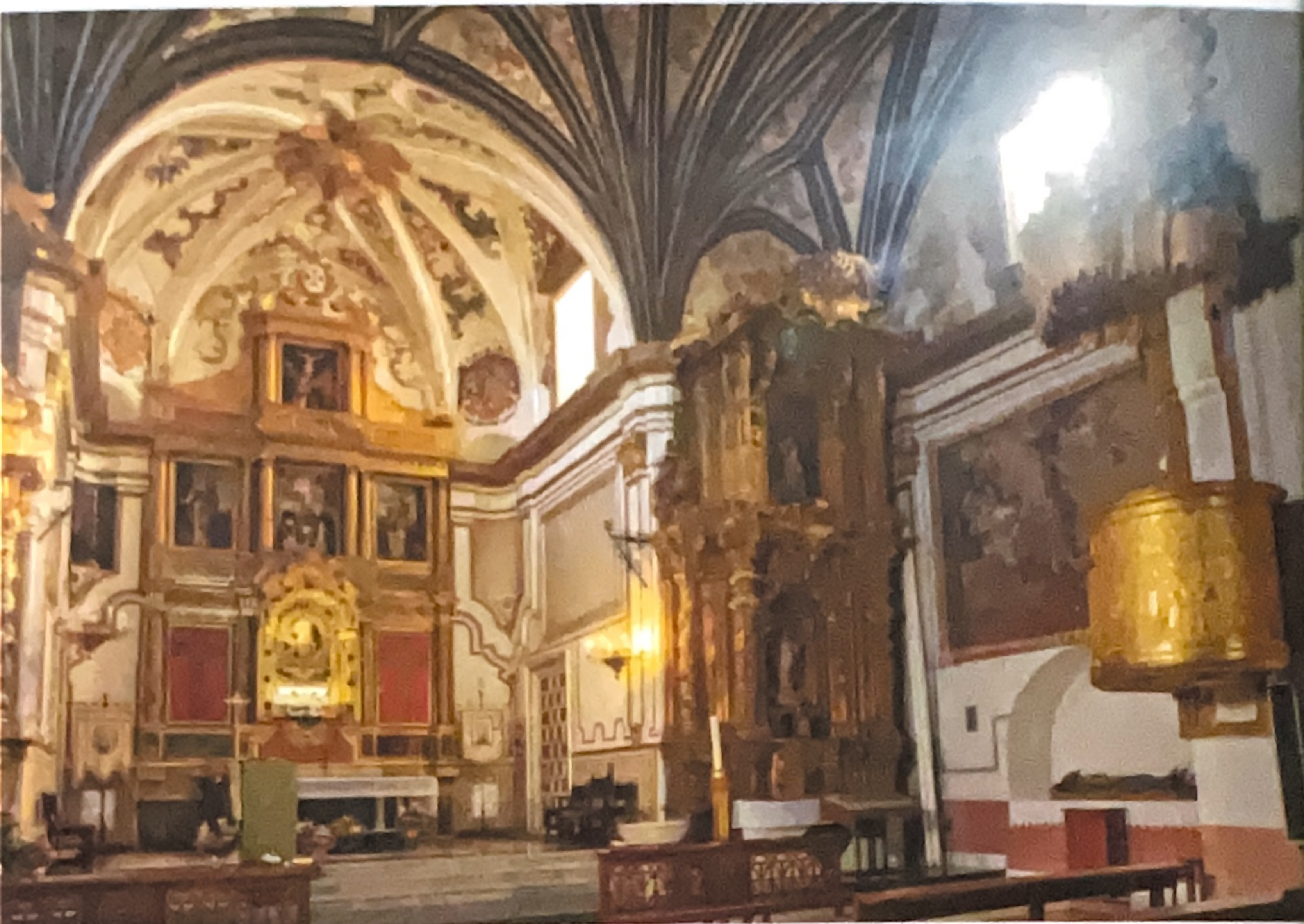
Interior del Monasterio de Tejada

El Monasterio de Tejada tiene dos claustros y dispone de un interesante doble claustro