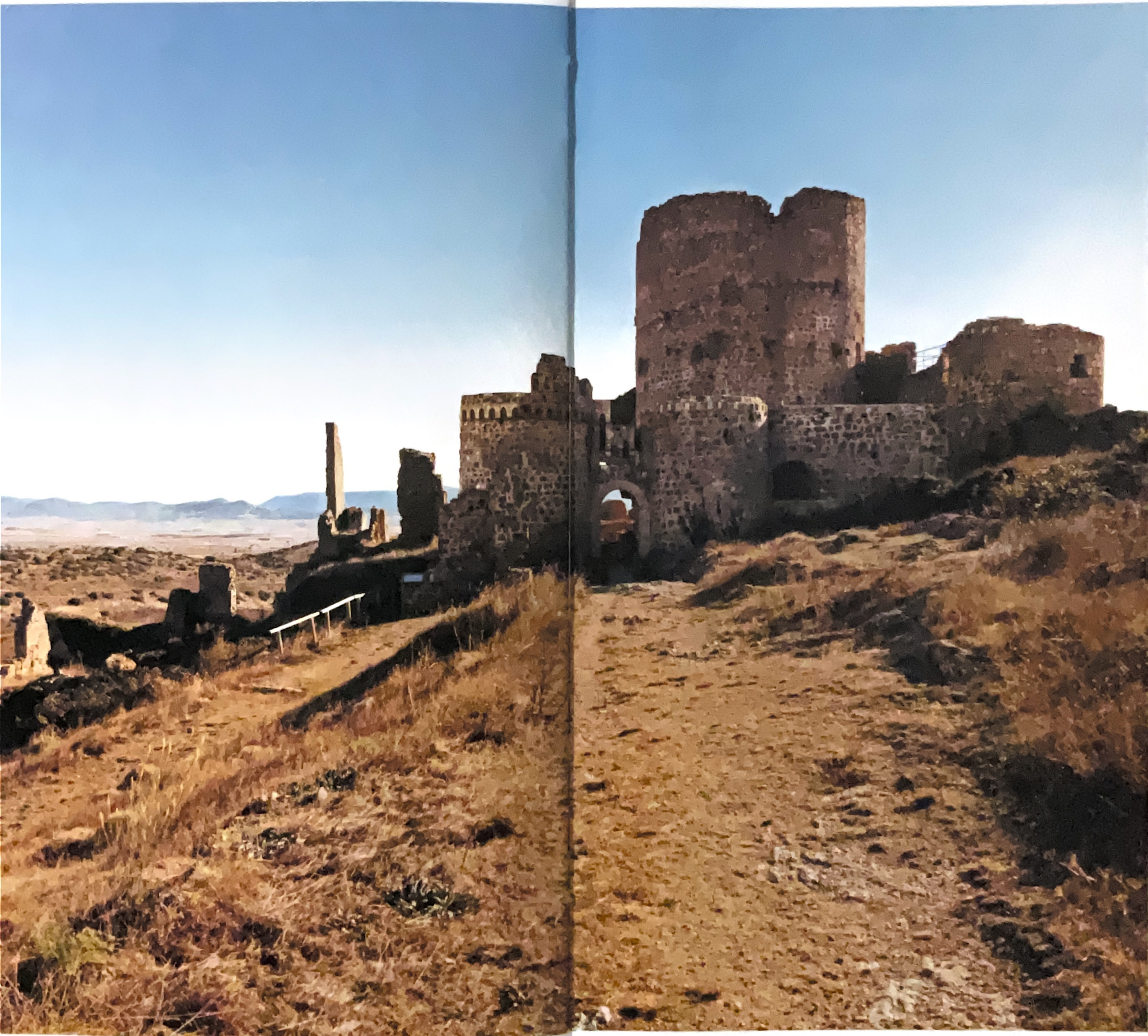
Entrada al Castillo, Moya