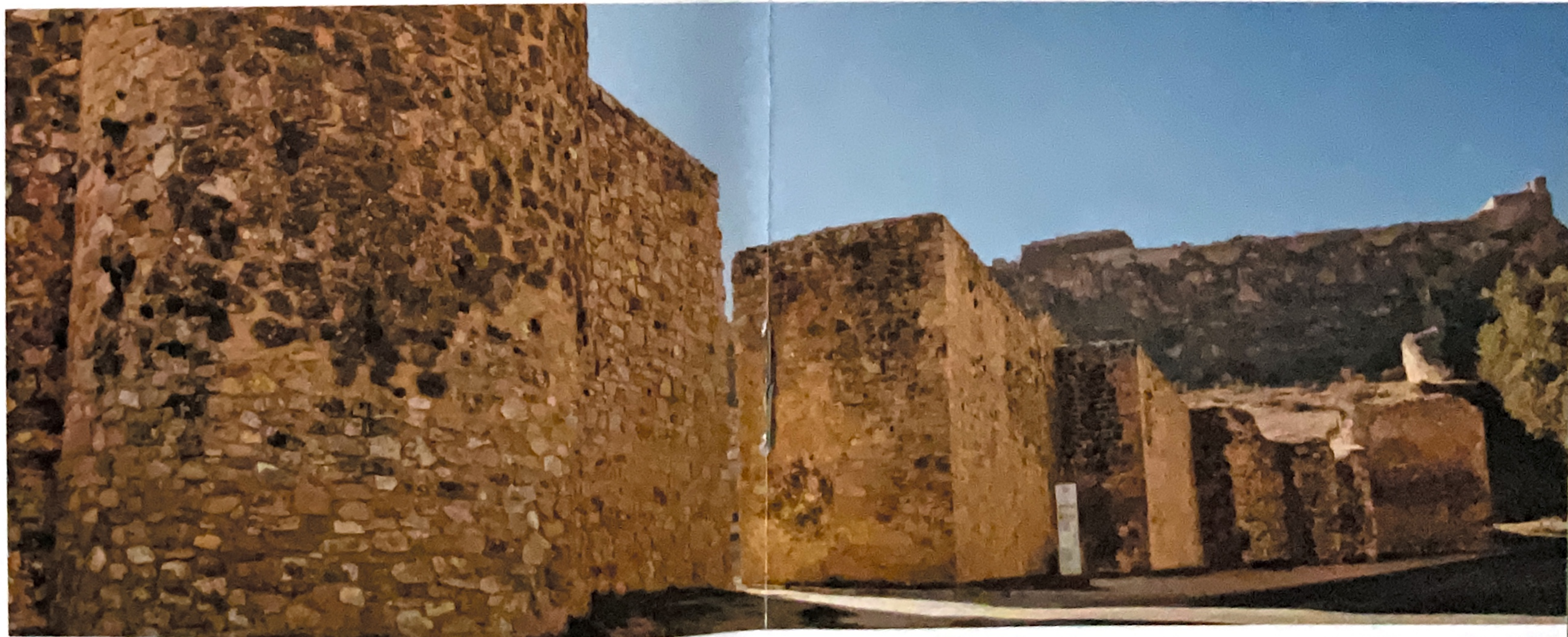
Muralla de Cañete

durante millones de años. El camino es una experiencia y una delicia para los sentidos. Cerros llenos de pinares, choperas y tierras de labor salpican hoces y riberas en un mosaico multicromático en el que se respira naturaleza. Paisajes para reconciliarse con la creación.