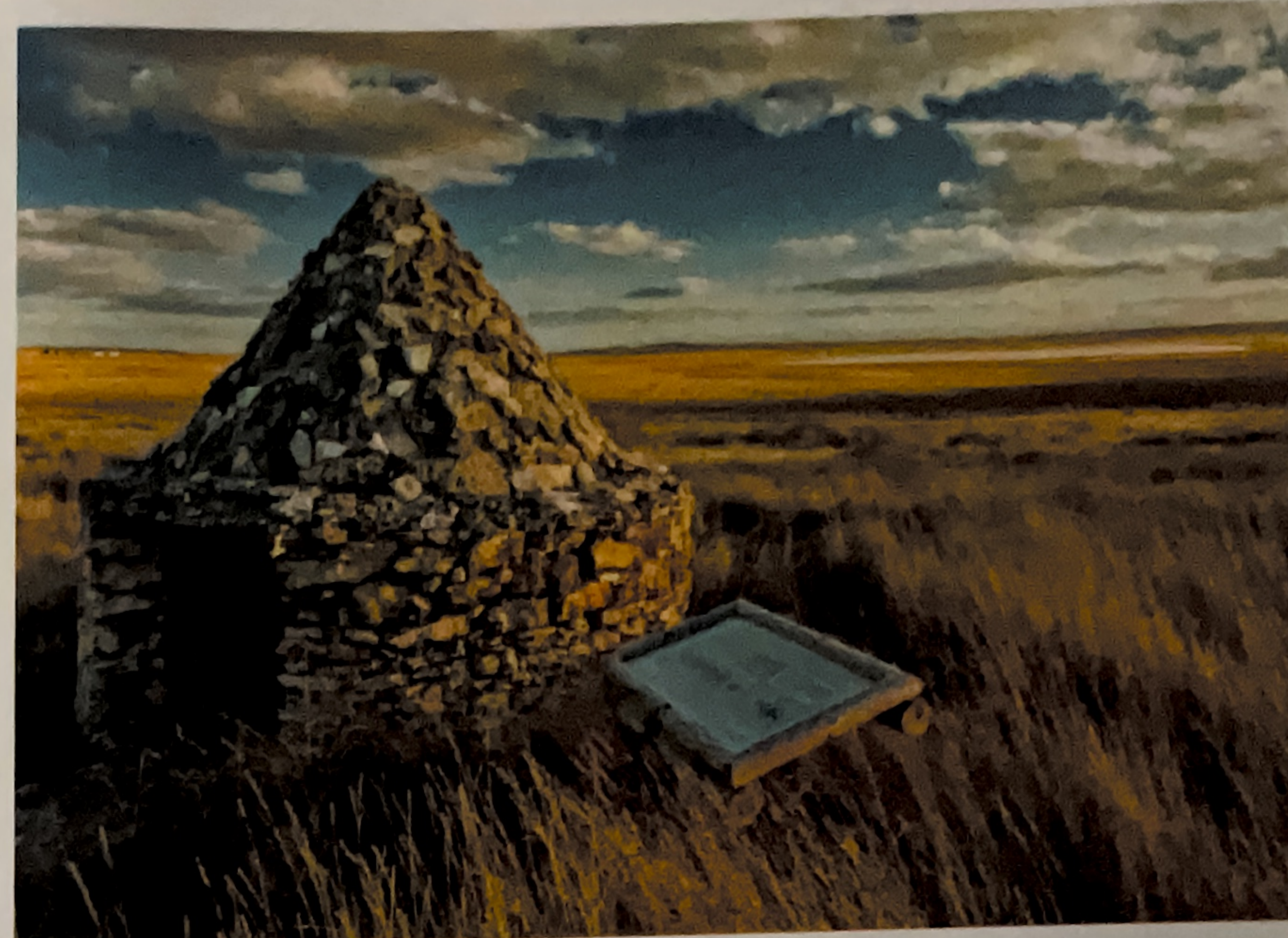
Laguna de El Hito

A lo largo de esta ruta nos adentraremos en el territorio en el que tuvo, y todavía tiene, su sede la poderosa Orden de Santiago, fundada en el siglo XI, cuyo fin era hacer retroceder a los musulmanes en la península y guardar las inestables fronteras de la época de la Reconquista. Tras un largo conflicto que se prolongó casi un siglo, Uclés es, desde 1230, la sede de la Orden, caput ordinis . La orden estuvo presente en la mayoría de las acciones militares de la Reconquista y sus posesiones se extendían por las provincias de Cuenca, Ciudad Real, Toledo, Guadalajara, Madrid, Jaén y Murcia.