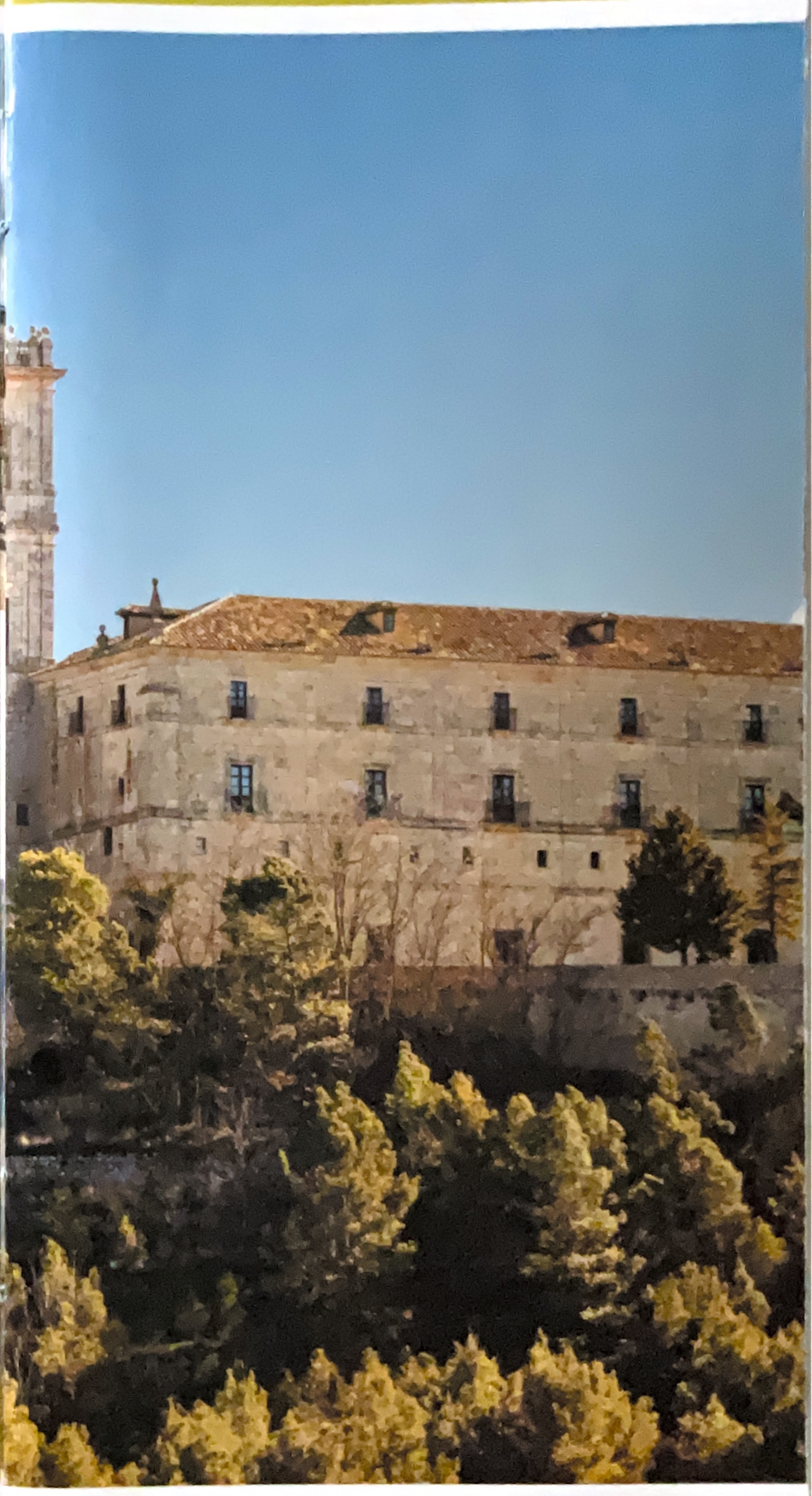
Monasterio de Uclés