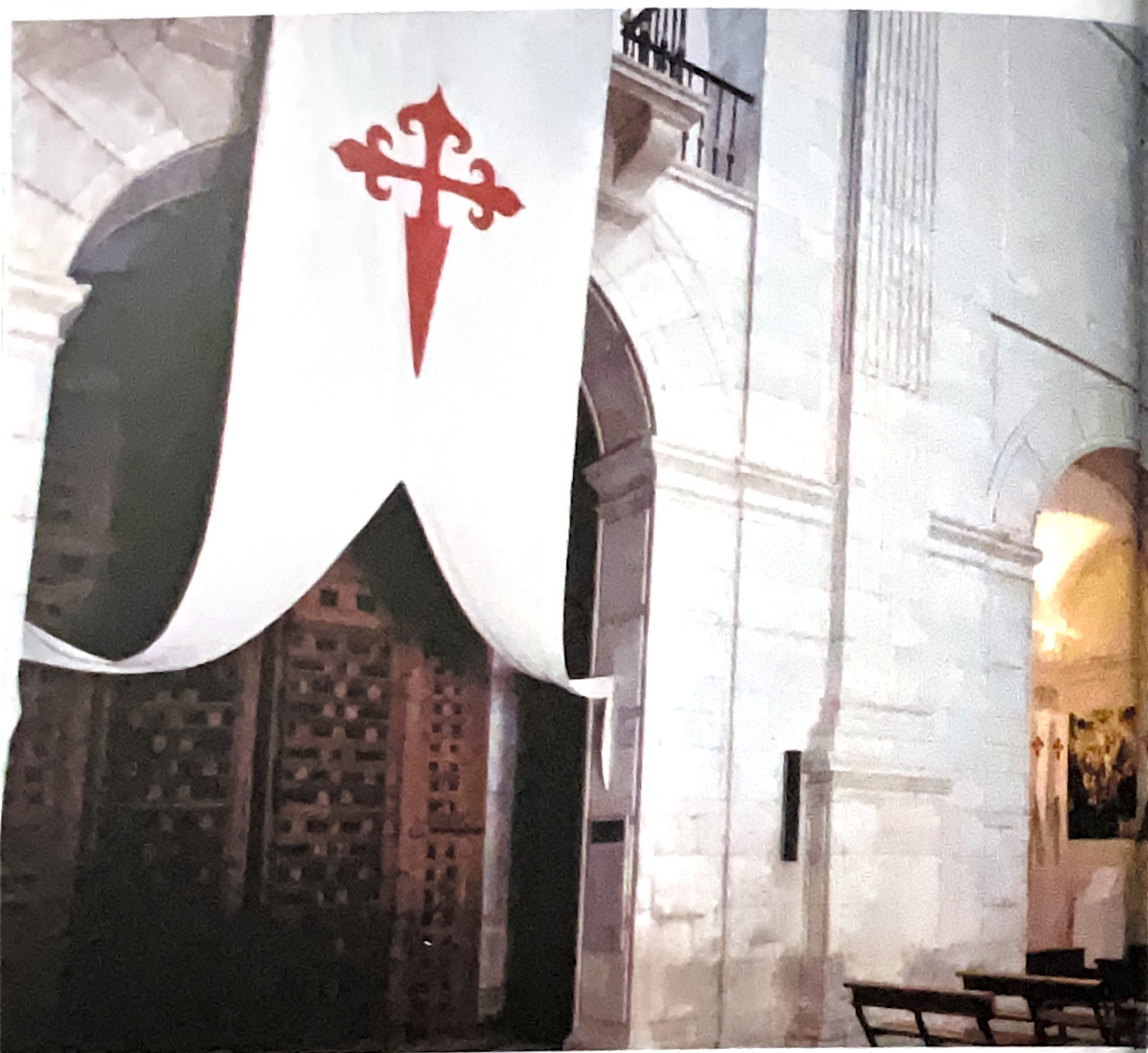
Interior del monasterio de Uclés

A Uclés se llega por la CM-310, la A-3 y la E-901. Desde varios kilómetros a la redonda impone la sobrecogedora presencia del Monasterio que fue cabeza de la poderosa orden de Santiago y que ha recibido el sobrenombre de 'El Escorial de La Mancha' por su majestuosidad.