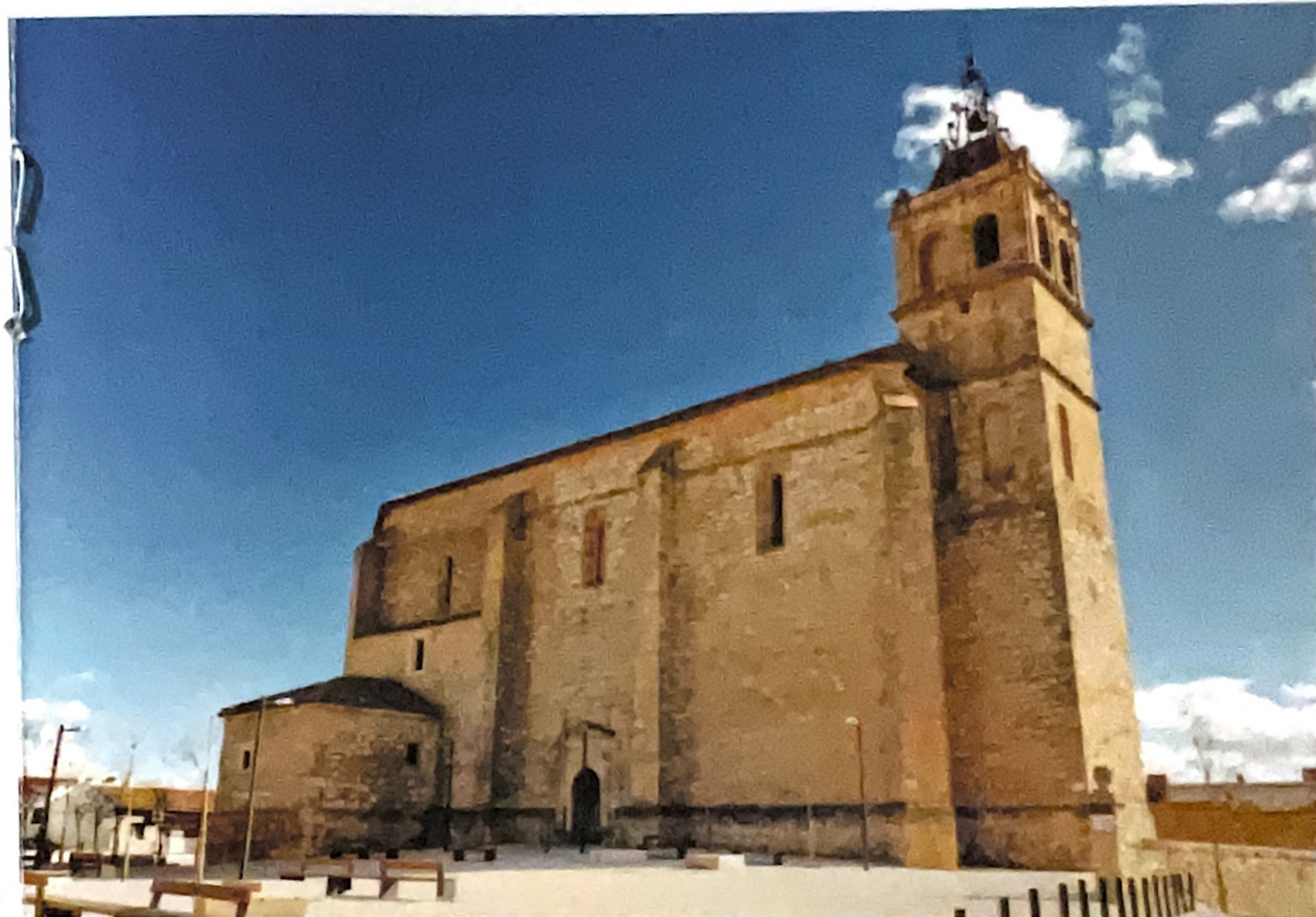
Iglesia de la Inmaculada, Horcajo de Santiago

Presenta un casco urbano lleno de interesantes construcciones típicas manchegas y de estilo renacentista como las de su Plaza Mayor. Frente