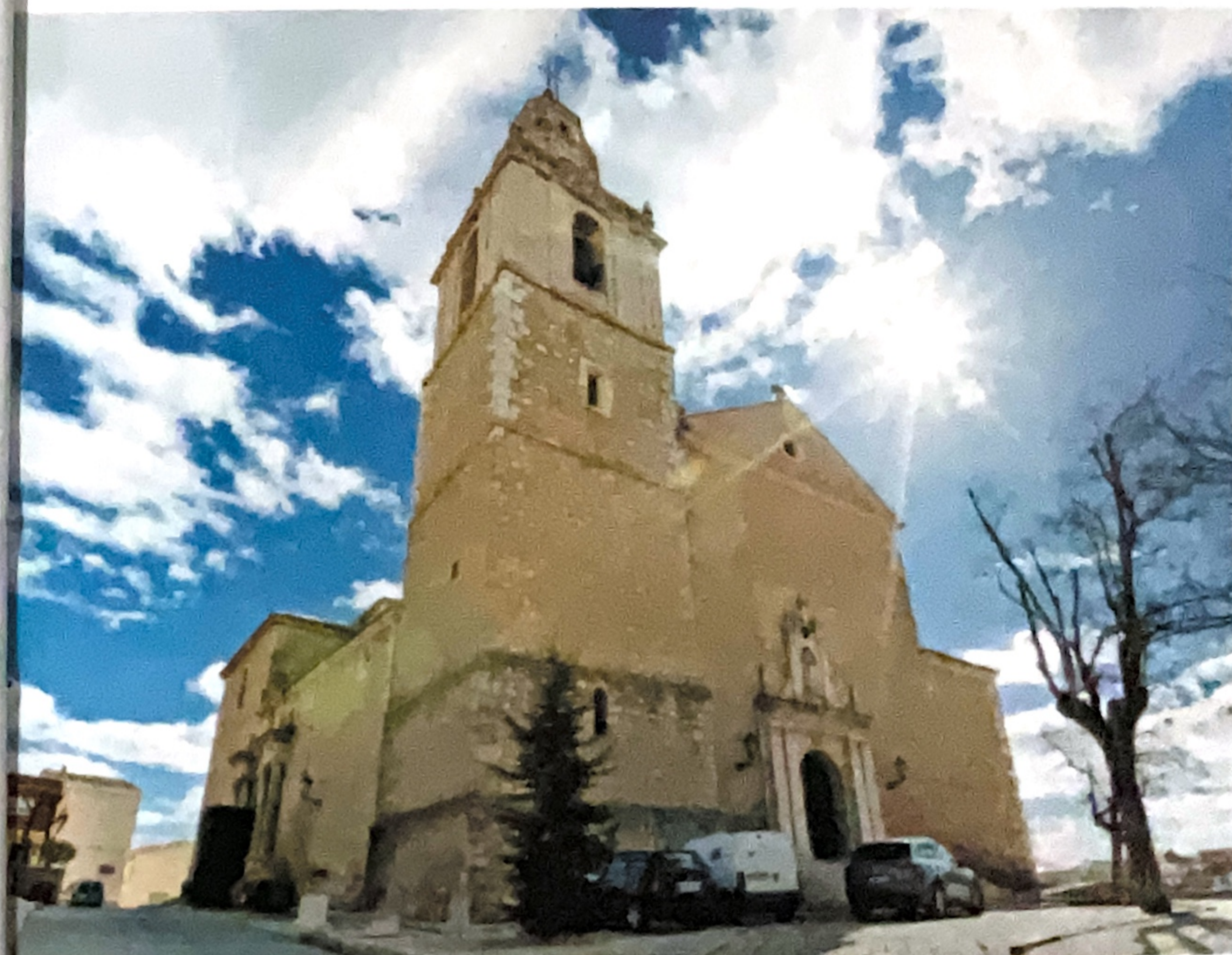
Nuestra señora de la Asunción, Tarancón