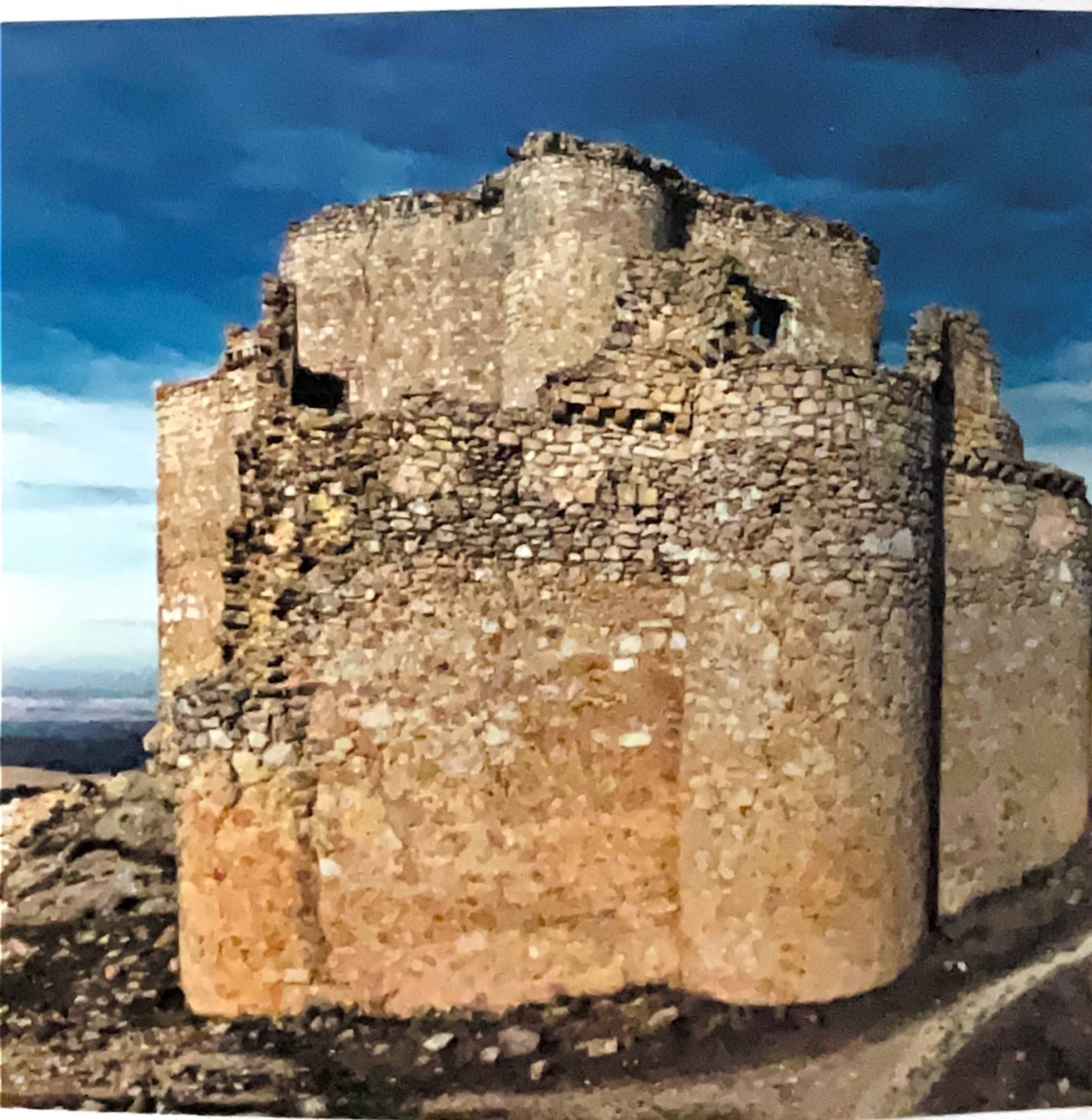
Castillo de Puebla de Almenara

La misma vía nos lleva hasta Puebla de Almenara, donde la silueta de su castillo domina un amplio territorio. Situado en un cerro de la Sierra Jarameña a 1.000 metros de altitud, desde él se divisan nada menos que diez términos municipales. Tiene su origen en una construcción anda-