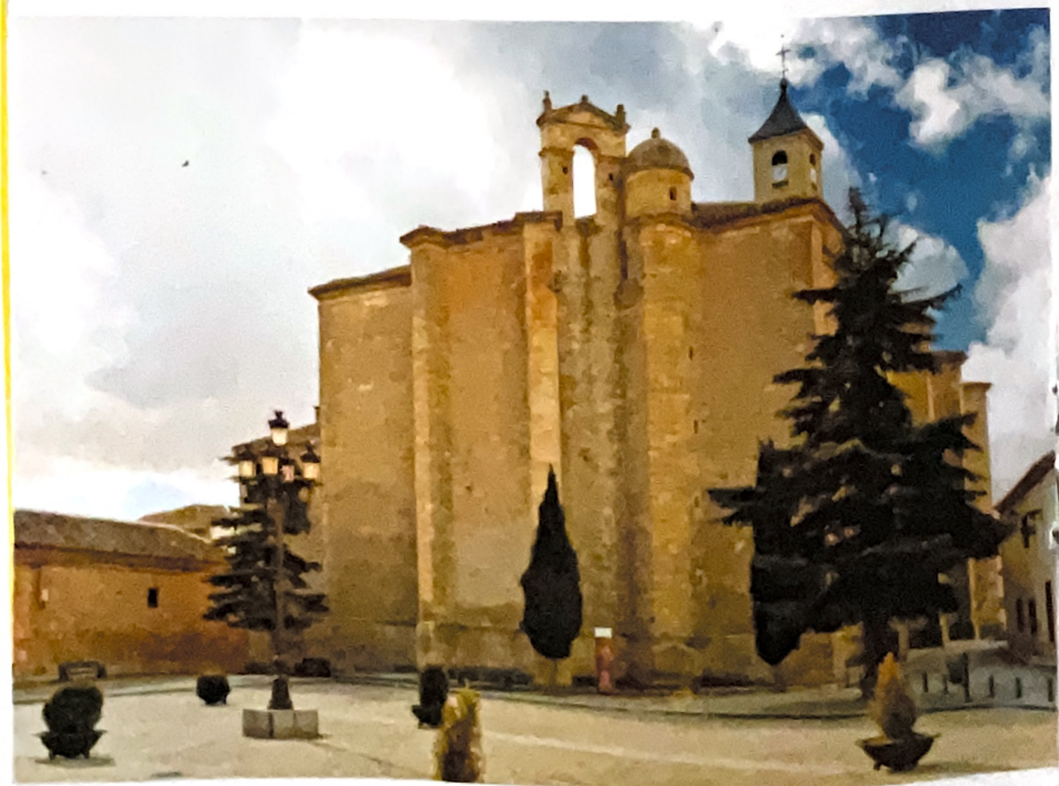
Iglesia de La Asunción, Villamayor de Santiago

Notables son también su antigua Notaría, la vieja cárcel, la casa de Hidalgos y Comendadores y la casa del Marqués así como sus curiosas casas-vivienda entre un amplio patrimonio.