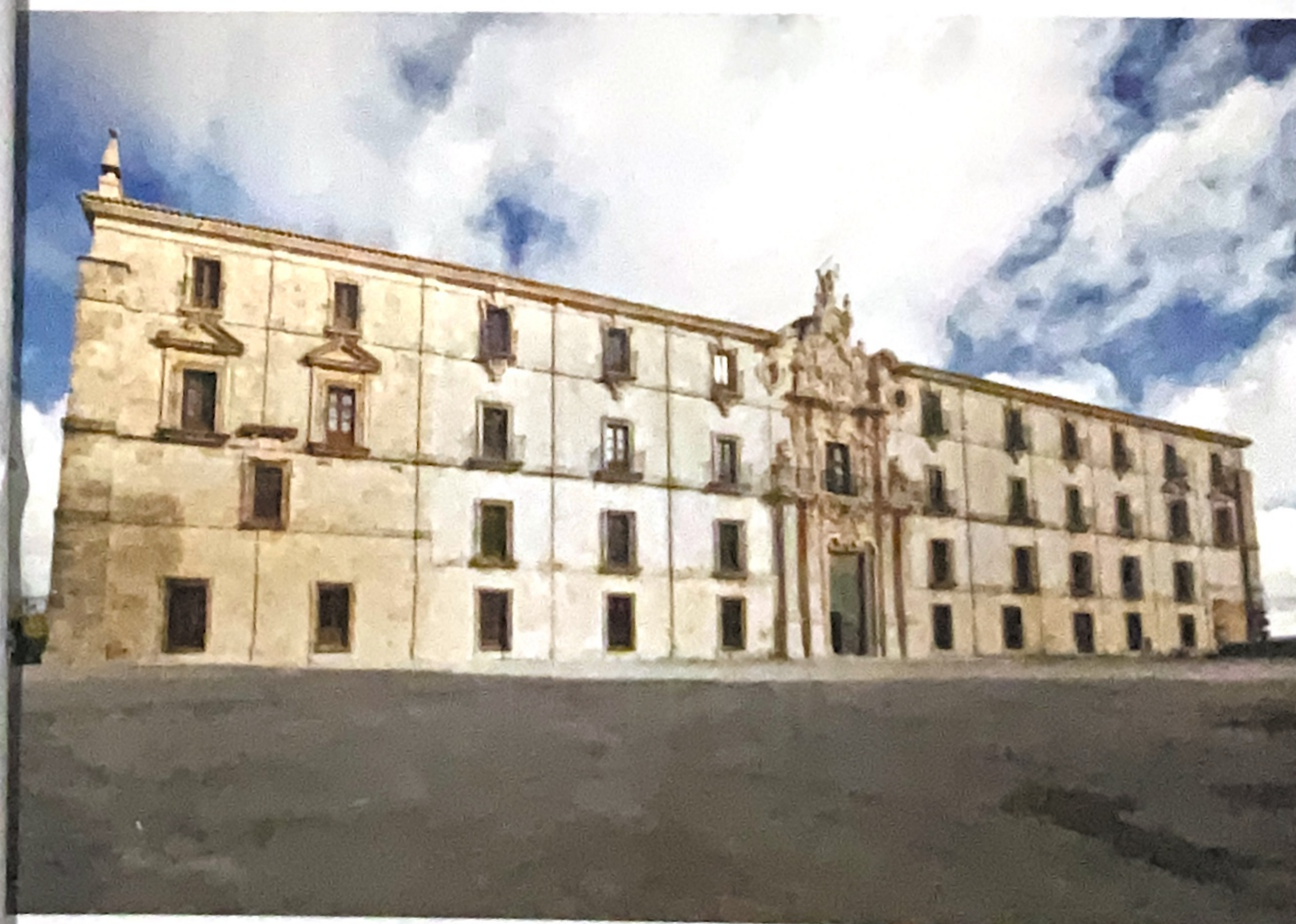
Portada principal del monasterio de Uclés

Segóbriga es un parque arqueológico de época romana con notables teatro y anfiteatro