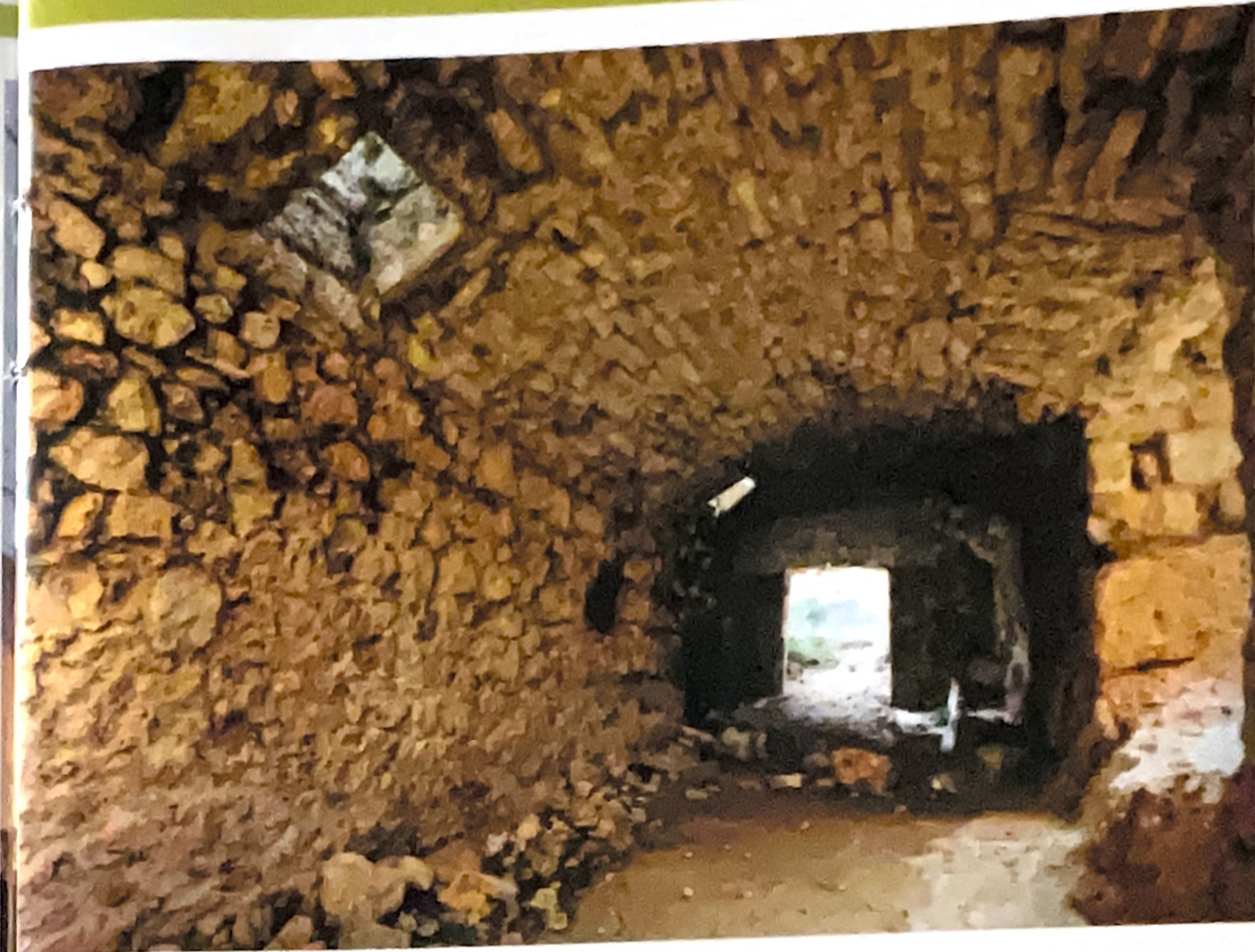
Castillo de Puebla de Almenara