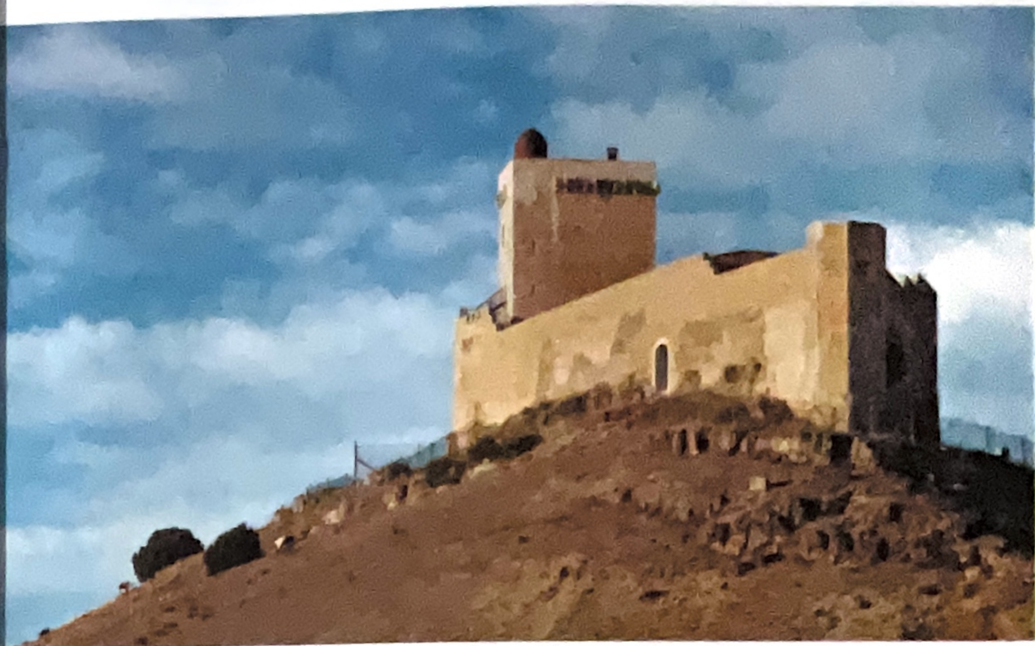
Castillo de Cañada del Hoyo

sufrió modificaciones dos siglos más tarde. Es un templo de bastante altura, que posee una sola nave que se divide en cuatro tramos. En su interior se puede apreciar que tres de ellos están cubiertos por bóvedas de arista y de media naranja la cabecera.