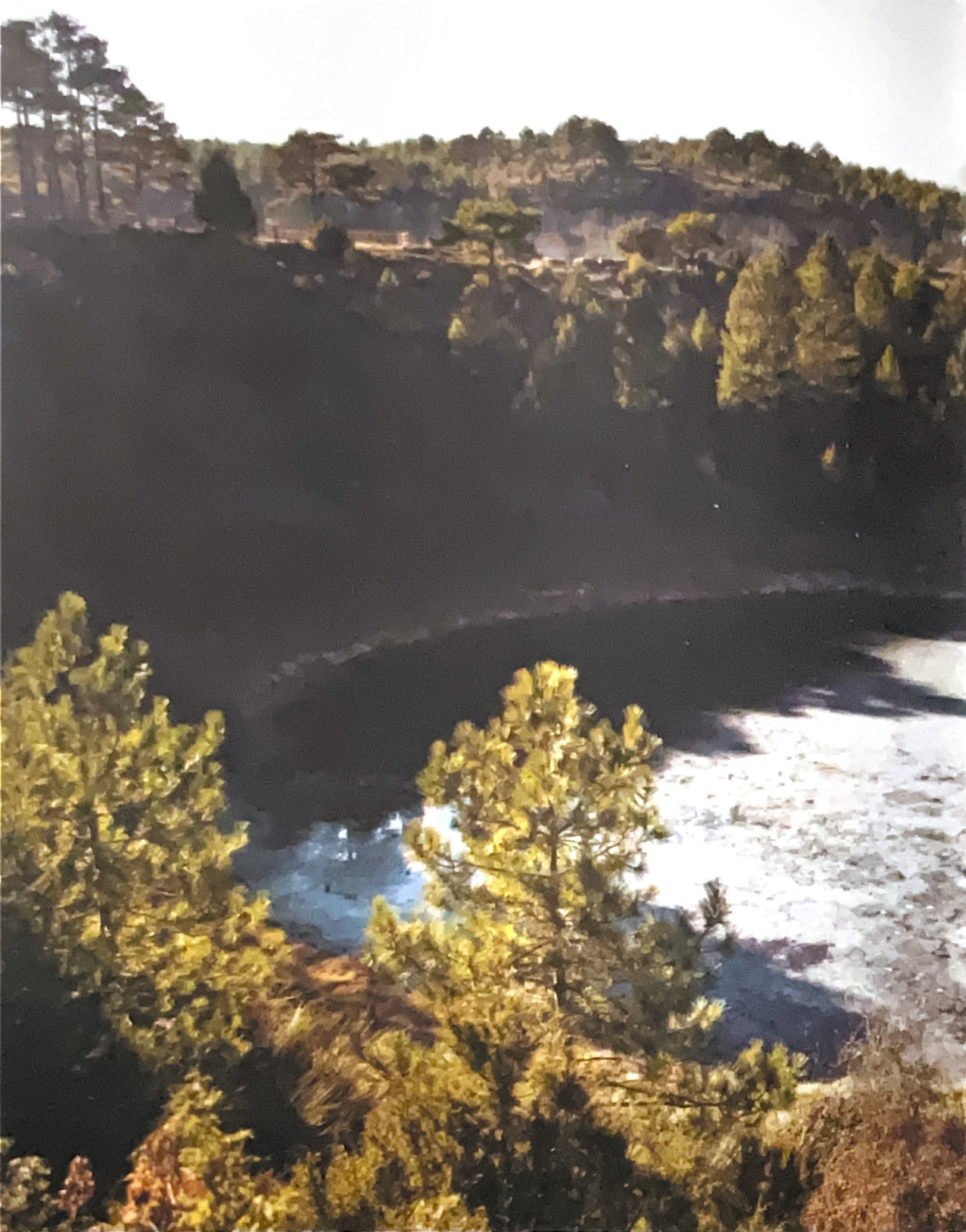
Lagunillo del Tejo, Lagunas de Cañada del Hoyo

Las lagunas son en esencia torcas cubiertas parcialmente por el agua, anegadas al alcanzar el manto freático