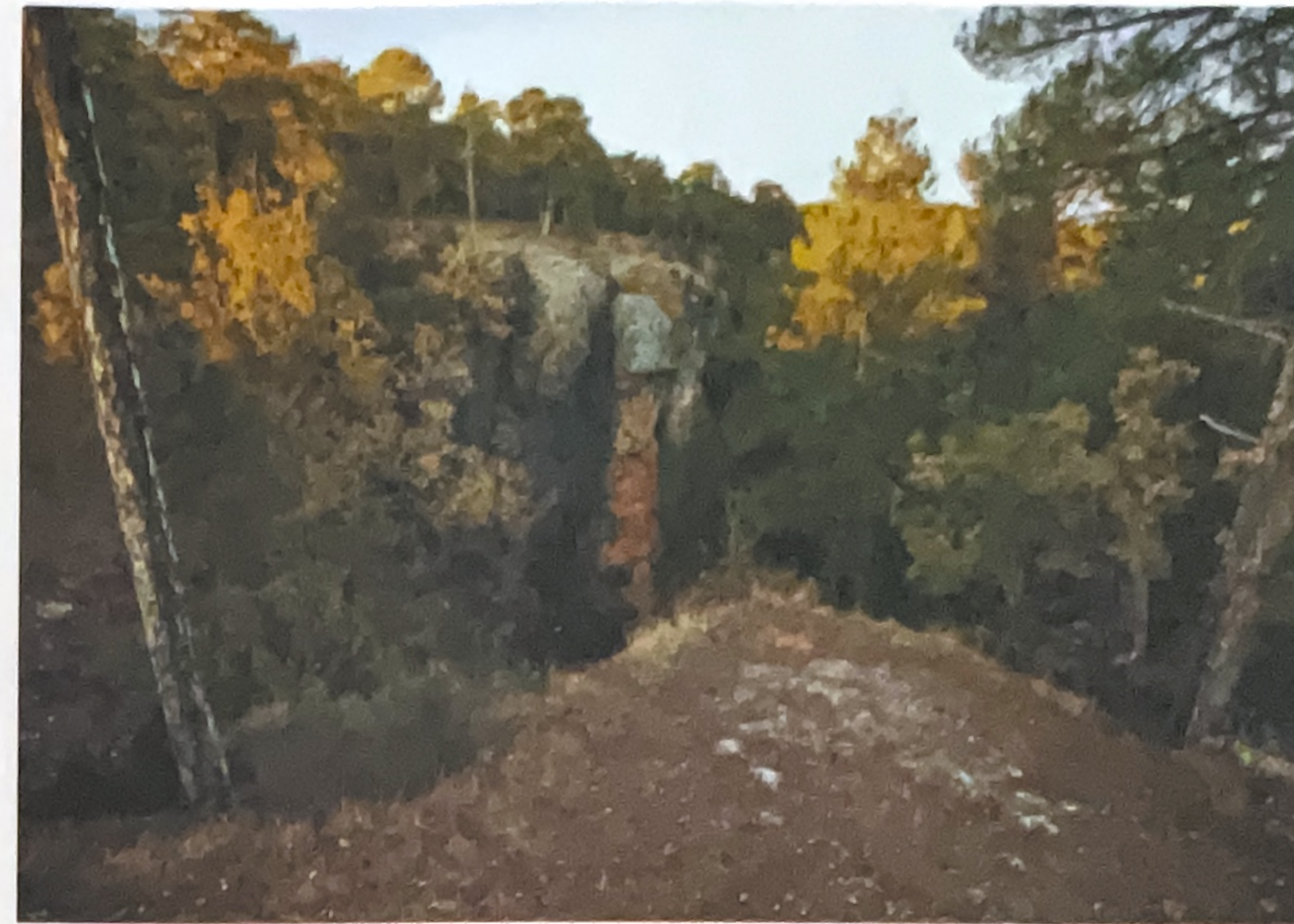
Torca del Agua

Cuenca posee un amplio y variado patrimonio forestal a lo largo y ancho de su provincia. Prueba de las maravillas y las sorpresas con que el milagro de la naturaleza obsequia al viajero son las Torcas, abismos inesperados en pleno Monte de los Palancares. A sólo 26 kilómetros de Cuenca, se accede a ellas por la carretera N-420 dirección Teruel y tomando posteriormente un desvío bien indicado antes de llegar a la localidad de Fuentes. Una vez en el paraje, se debe dejar el vehículo y comenzar un paseo en el que nos sumergiremos en la huella que la evolución natural ha dejado indeleble.