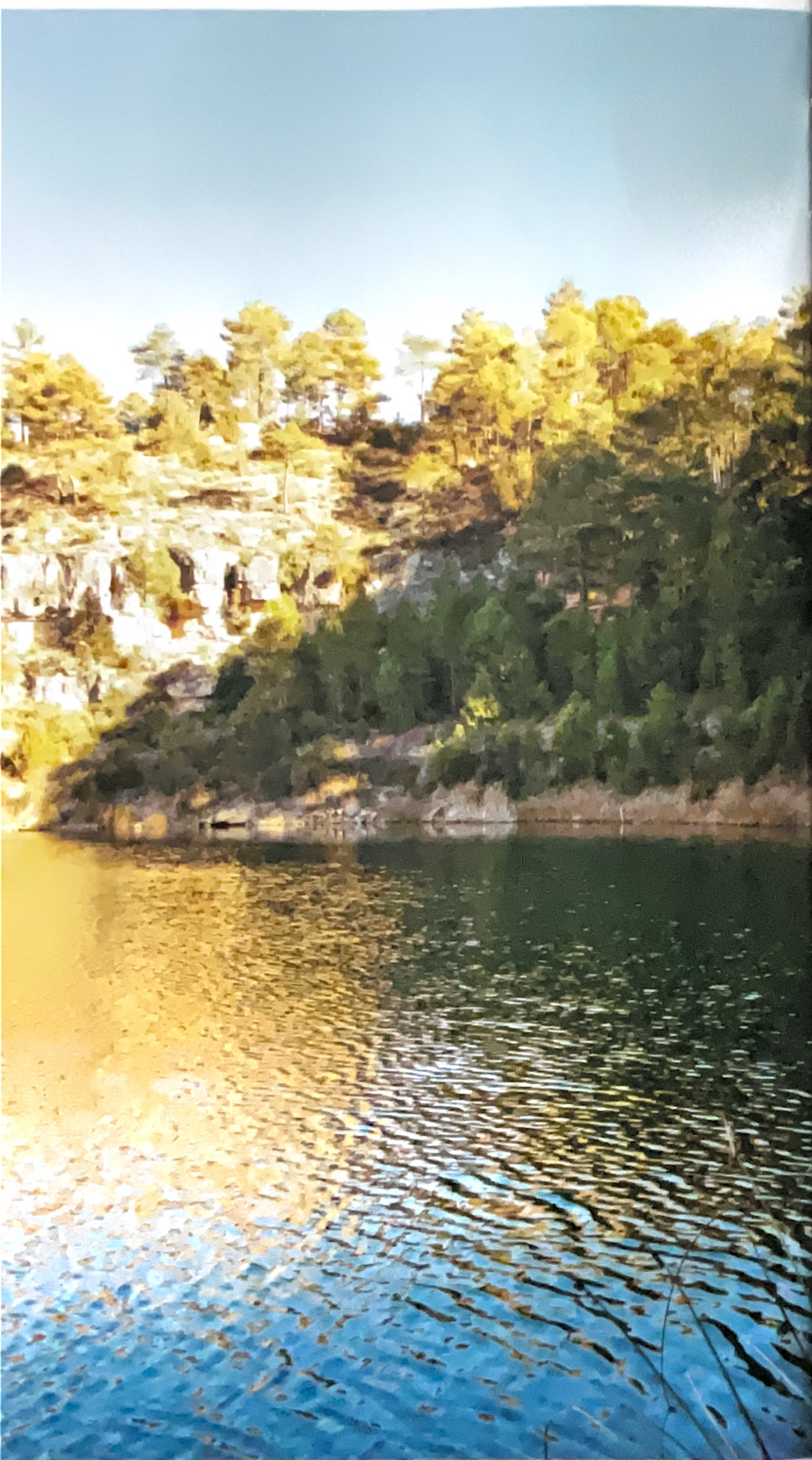
Laguna de la Gitana, Cañada del Hoyo