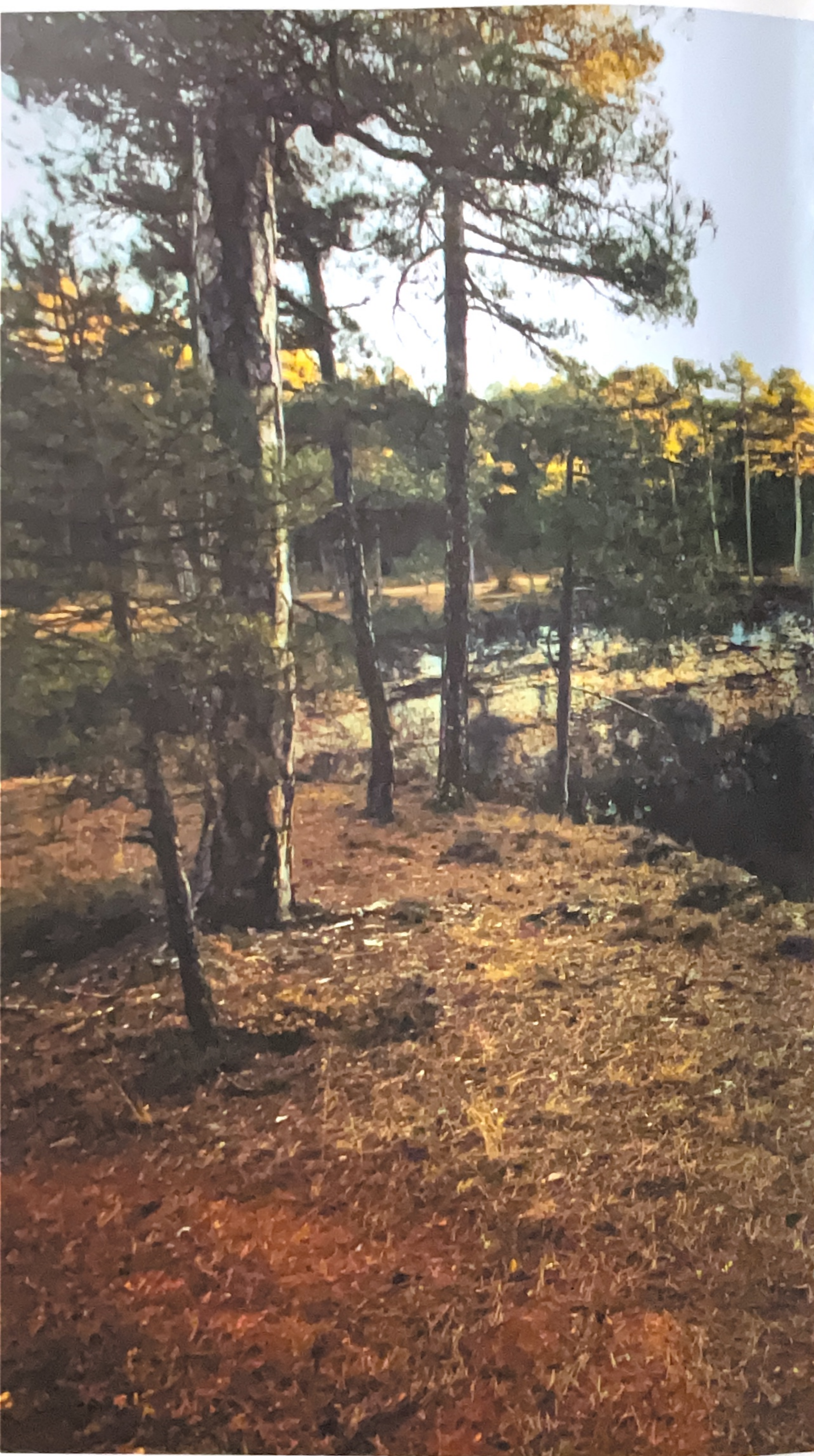
Torca de la Novia