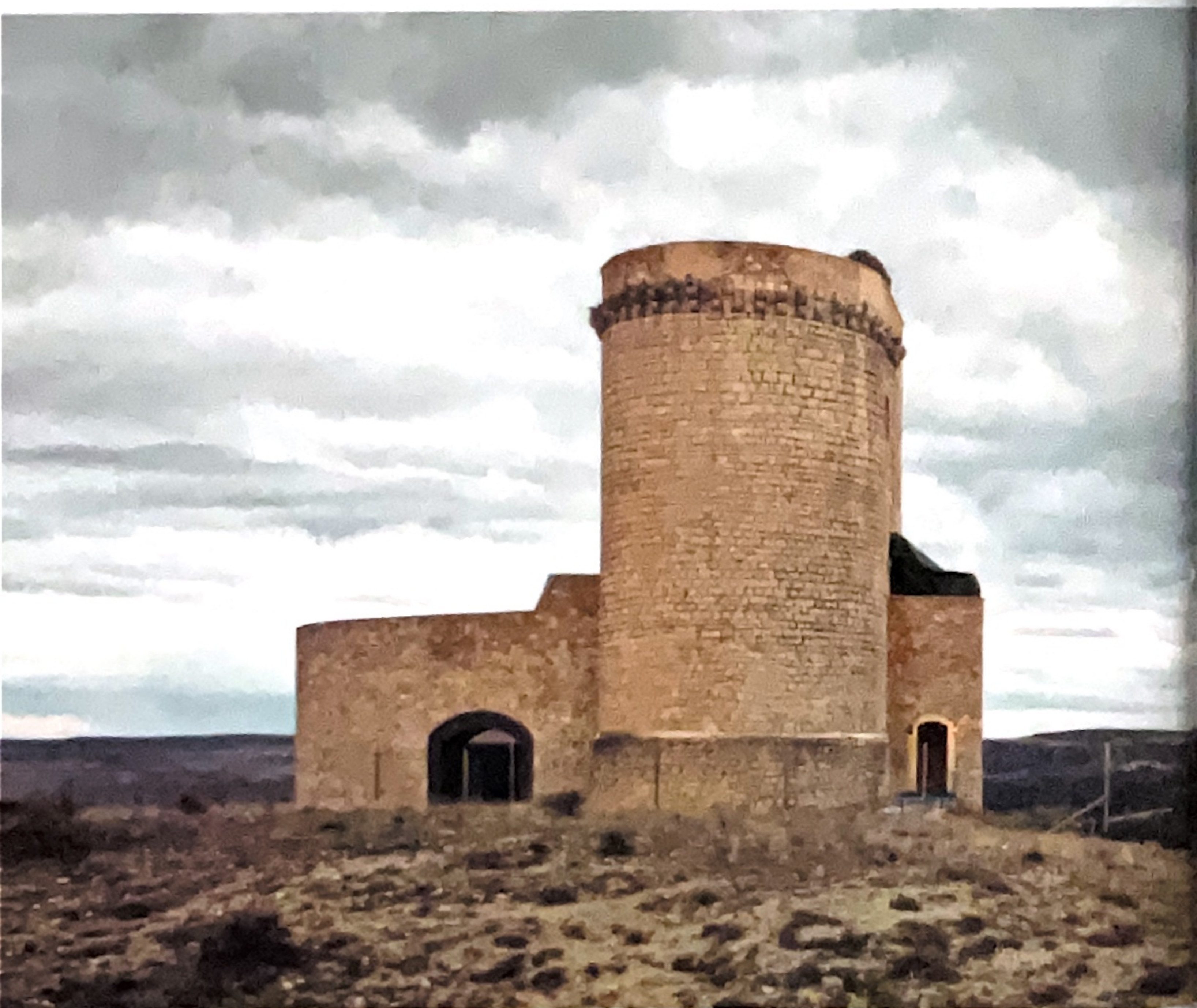
Castillo de Cañada del Hoyo

Dentro de esta localidad se puede visitar también la iglesia parroquial de Nuestra Señora de la Nieves, construida en el siglo XVI, aunque