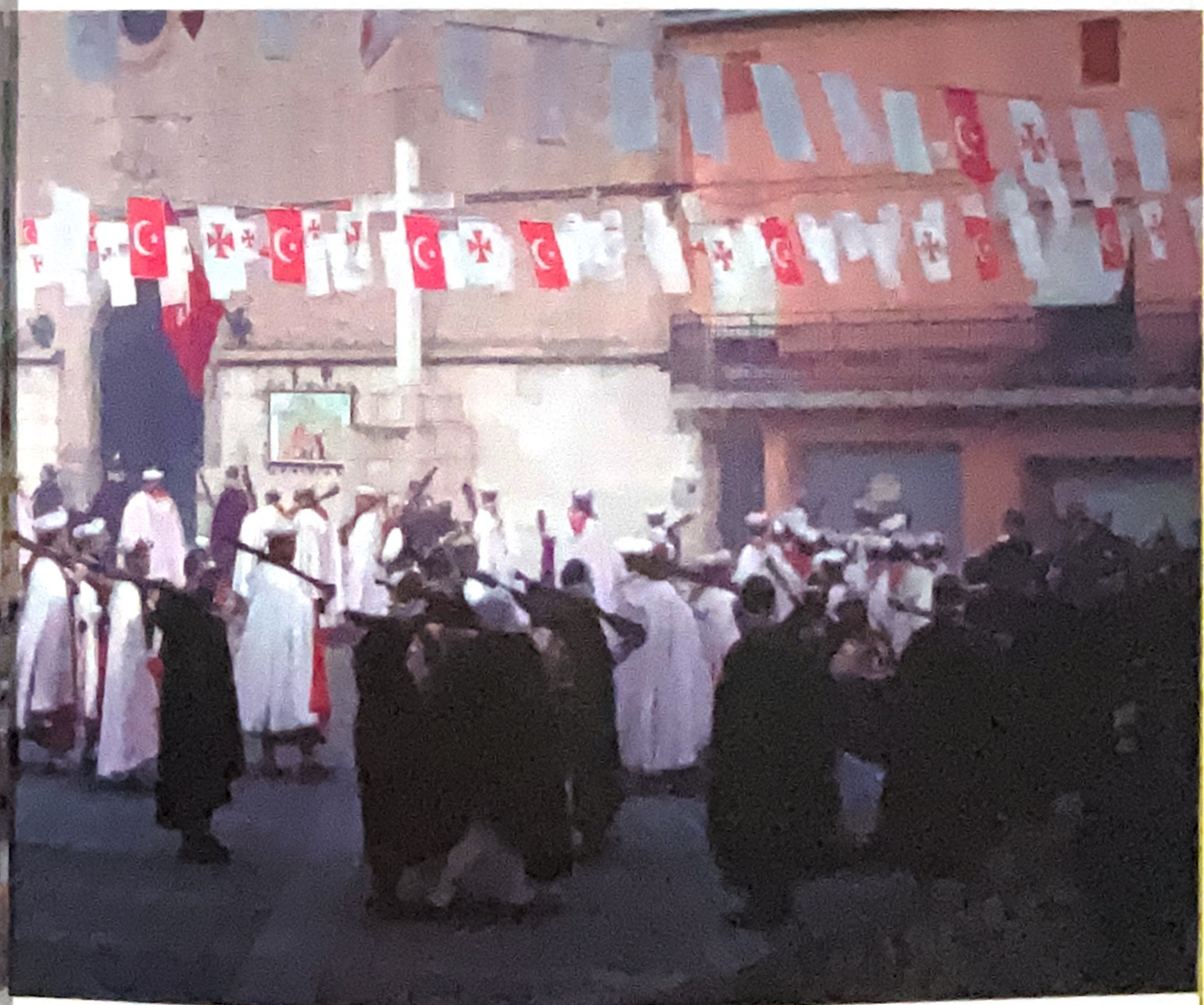
Fiesta de Moros y Cristianos, Valverde del Júcar