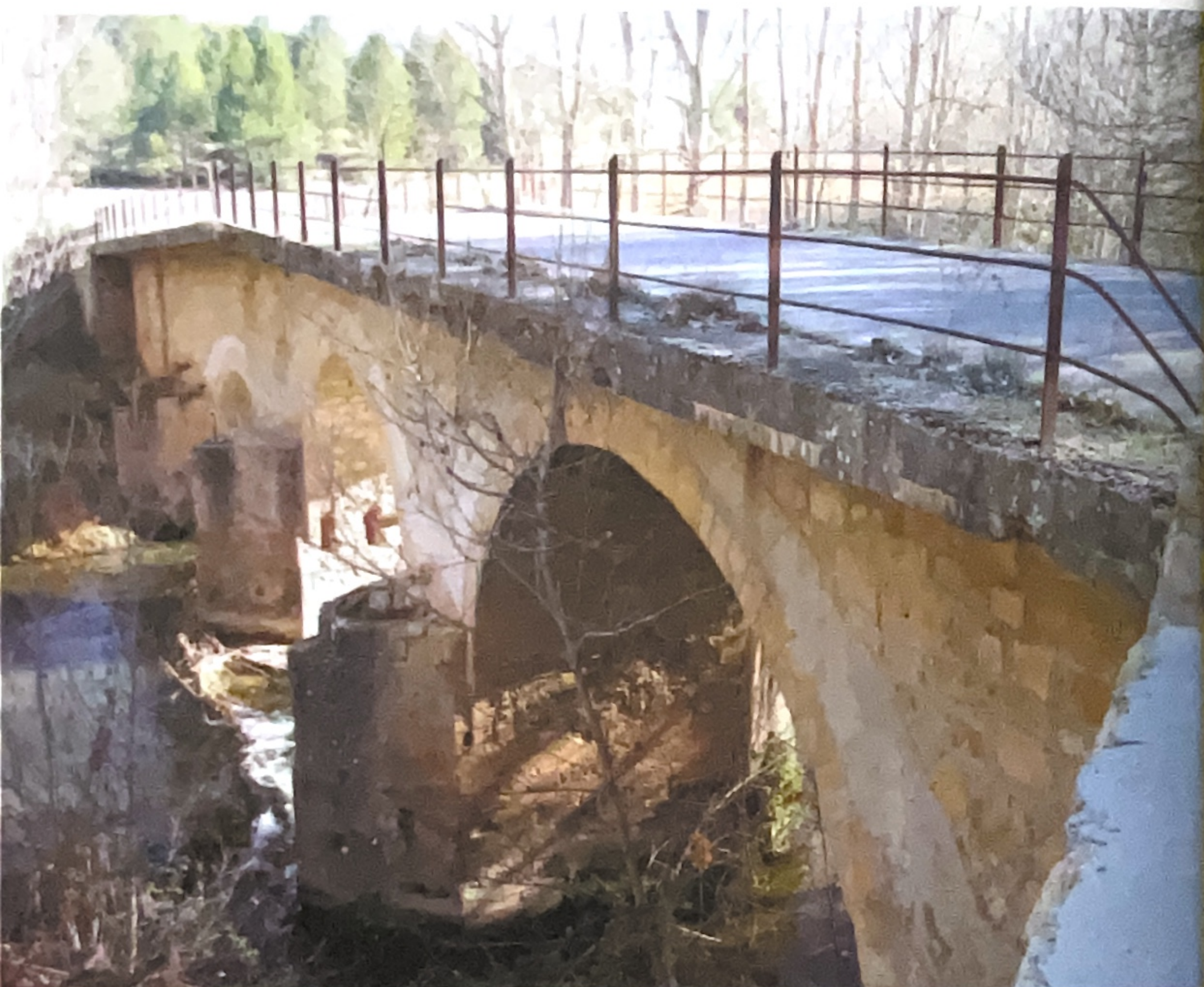
Puente Palmero, Villar de Olalla.

En el Puente Palmero se unían los grandes rebaños provenientes de la montaña para marchar, trashumantes, hacia Andalucía