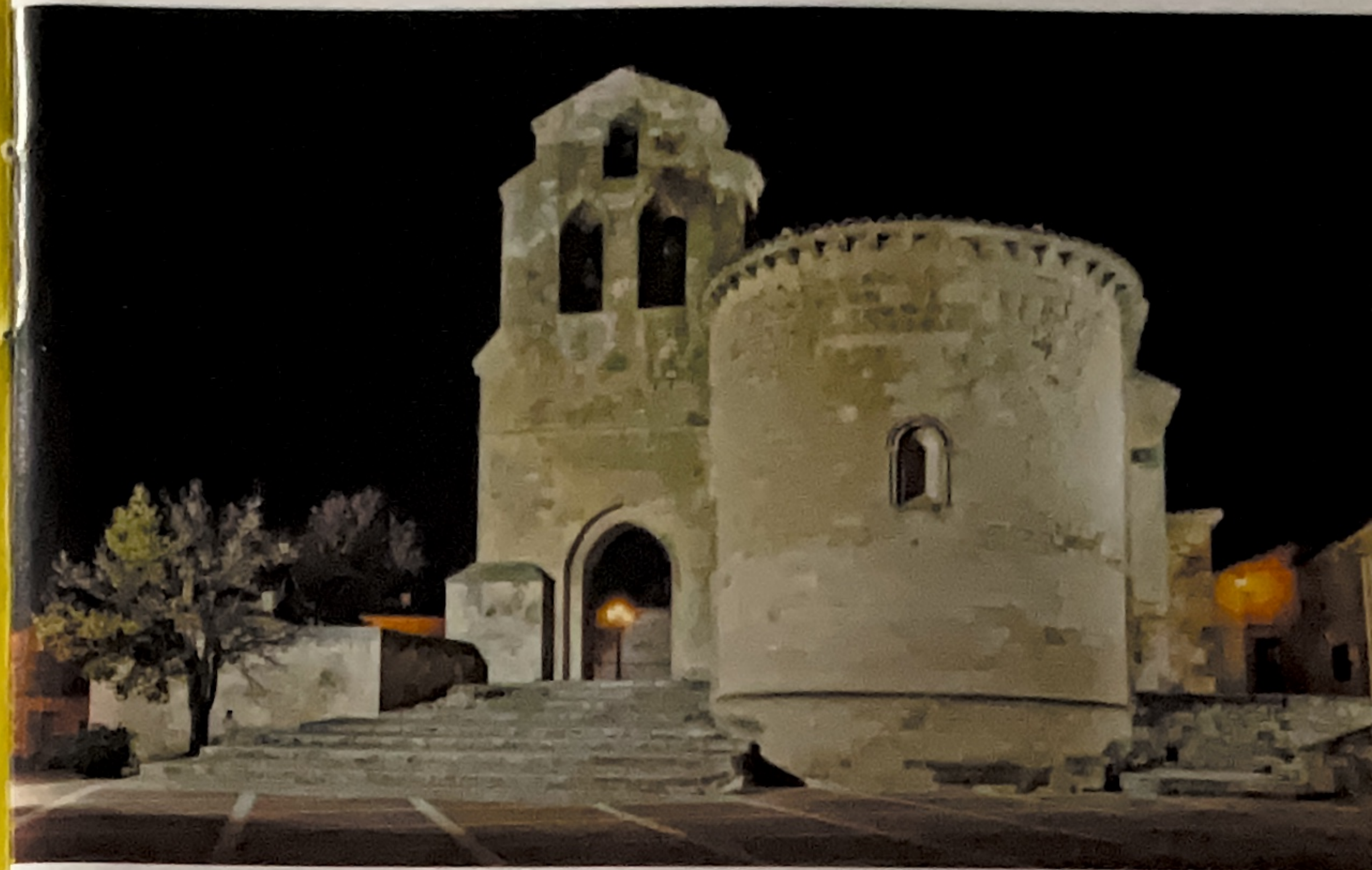
Nuestra Señora de Natividad, Arcas

Muy cerca, a apenas 10 km, de Cuenca , saliendo por la carretera CM-220 y tomando con posterioridad un desvío, Arcas guarda uno de los más hermosos y espléndidos tesoros del románico conquense, la iglesia de Nuestra Señora de la Natividad, templo del siglo XIII de una sola