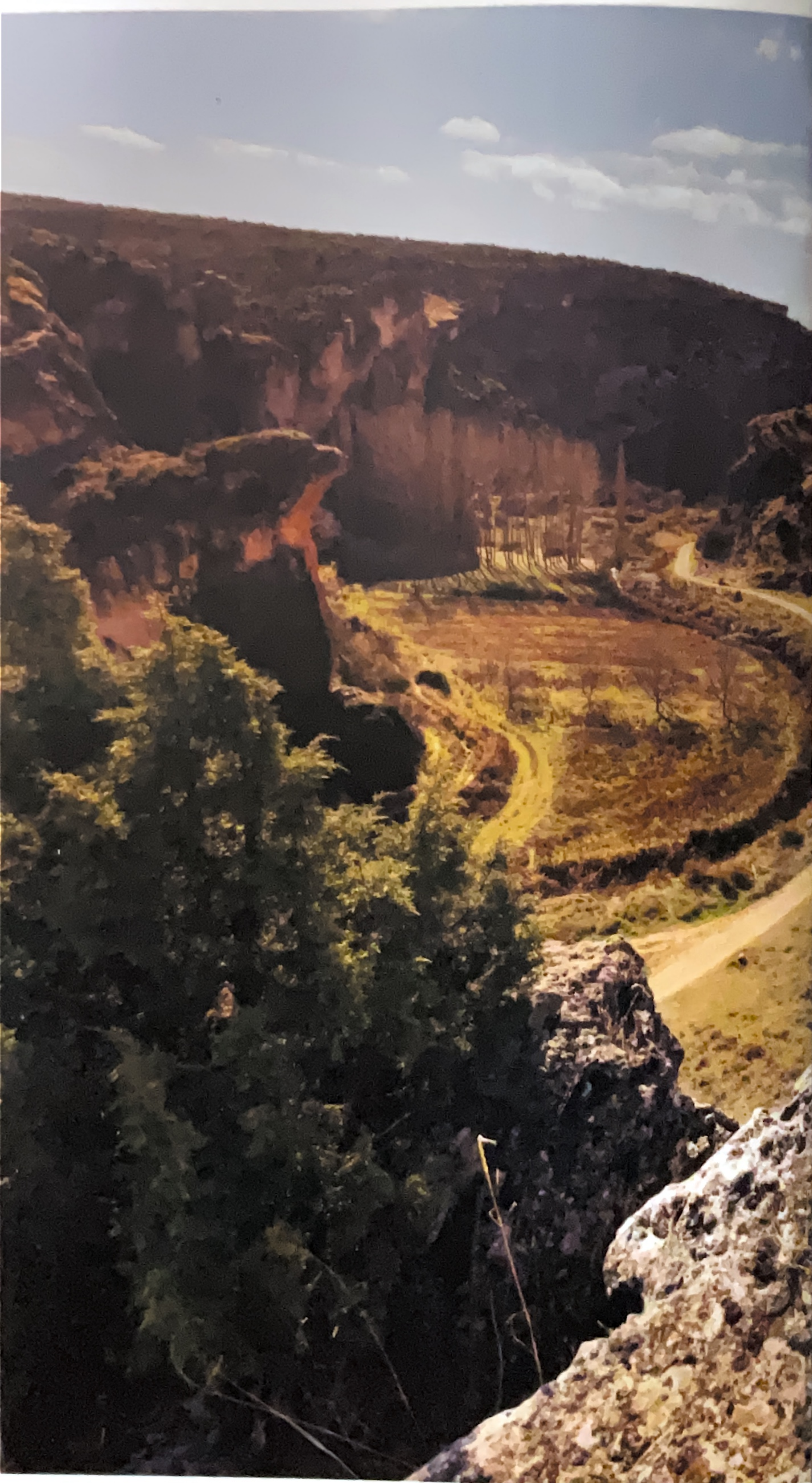
Hoz del río Gritos