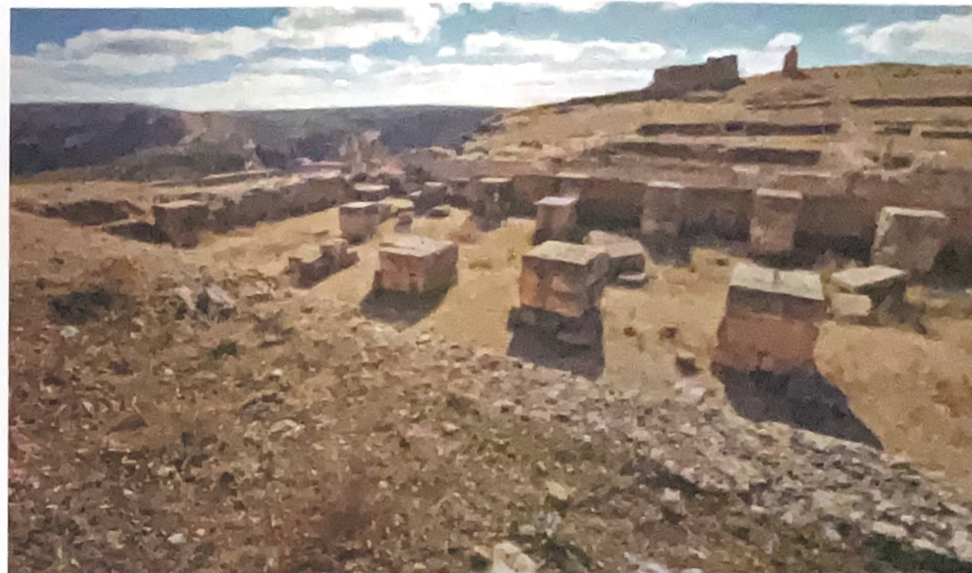
Ruinas del foro romano, Valeria

apreciar restos del foro con sus pórticos, de época de Augusto y que constituía el punto central de la ciudad, de la basílica, dedicada al culto al emperador, y de las tabernas, que contenían tiendas, almacenes y talleres. Pero no puede el viajero abandonar Valeria sin disfrutar a lo largo y ancho del ninfeo, cuyo muro de contención se extiende 105